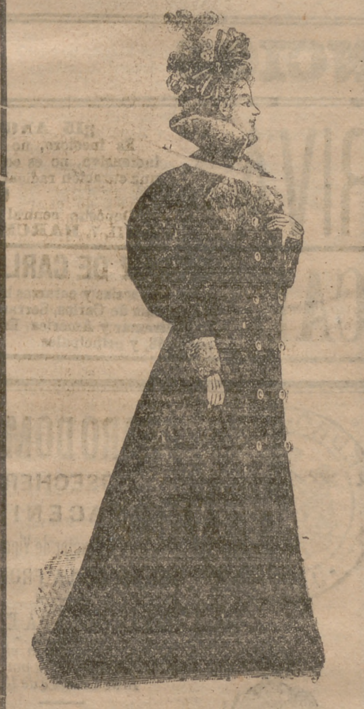
Abrijo-redingote.—De paño oscuro ó negro, con vueltas, bocamangas y cuello de pieles. Con preferencia se usa el paño azul.