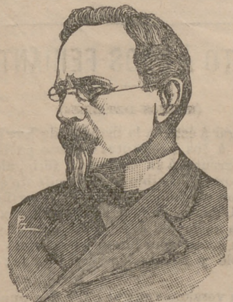
D. Federico de Madrazo

Segun anuncia la prensa de Madrid llegada hoy á Sevilla, la gravedad de la dolencia que viene sufriendo el ilustre pintor D. Federico de Madrazo, ha tenido remata con una operación de la que salió con total felicidad. Esta noticia ha de causar, seguramente, inmensa alegría entre los pintores españoles de quienes el venerable maestro es decano. El nombre de Madrazo se ha extendido popularmente de uno á otro extremo de España, donde no hay quien deje de admirar al eximio artista, gloria nuestra. En el extranjero siempre que se habla de Madrazo úsenese á su nombre adjetivos encomiásticos que prueban palmariamente el respeto y la estimación de que goza el viejo pintor. Hablar de este sería relatar una historia conocida por todos los artistas de España, historia llena de páginas brillantes en el campo de la justicia y cubierta de señales de inspiración y talento. No hay Exposición que no haya legado una medalla á Madrazo. No hay estudio donde no figure algo copiado de lo que trasladó al mundo aquel excelente pincel. No hay artista que mire con indiferencia un cuadro de nuestro biografiado.