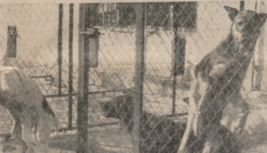
Perro enclaustrado en un piso?

—Que es un disparate. Estos animales son bellos por las cualidades peculiares que tienen: sus sentidos (el olfato sobre todo) están muy agudizados, sus músculos bien desarrollados y conservan un algo de orgullosa libertad. En cautiverio pier-