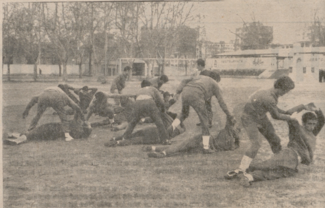
Estos son los jugadores del Rayo Vallecano cuando estuvieron el año pasado en nuestra ciudad entrando en Las Gaunas.

Pese a que en Madrid existen dos equipos de Primera División, el Rayo Vallecano cuenta con 6.000 socios, muy pocos de los cuales faltan en el campo de Vallecas cuando juega su