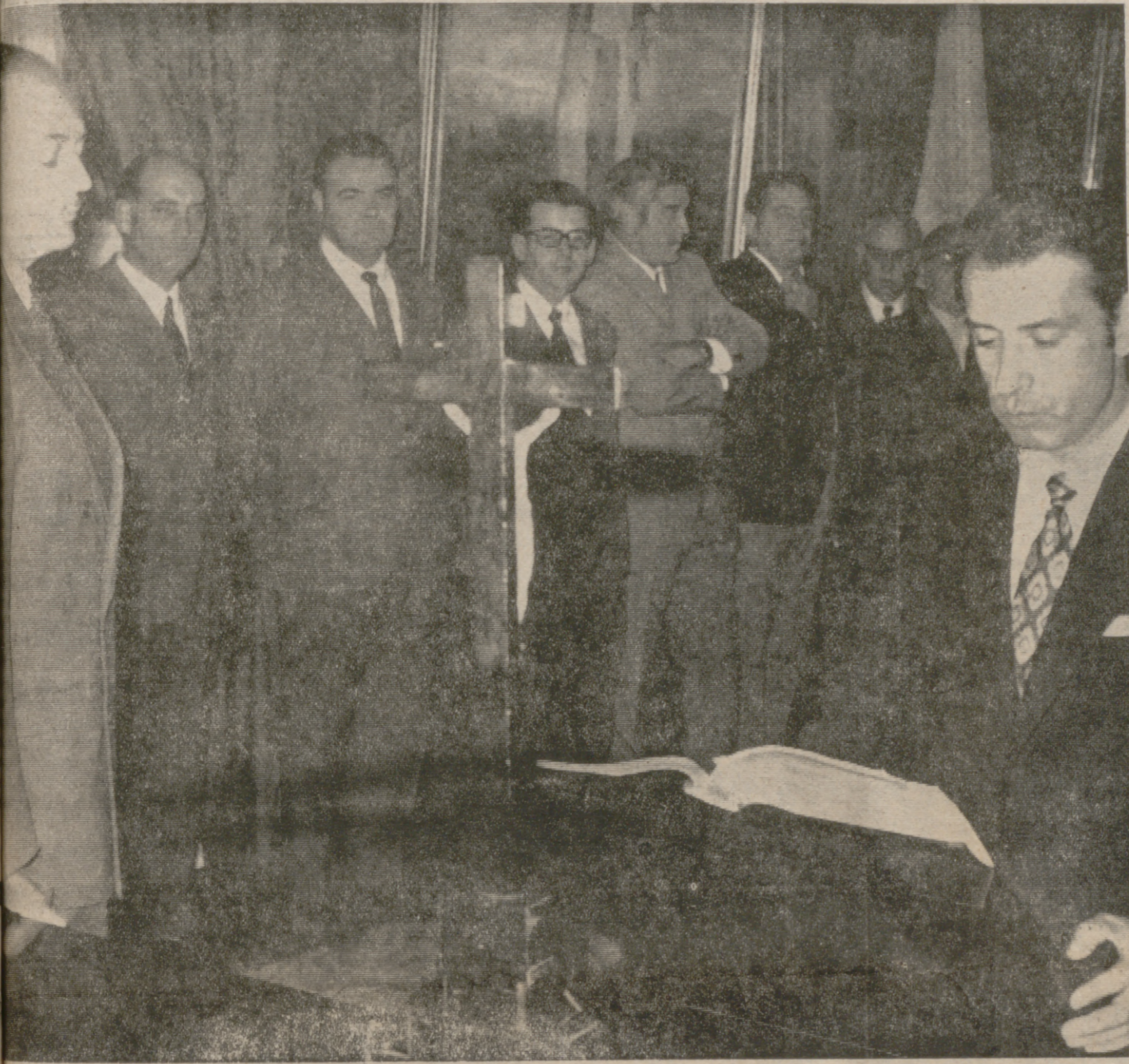
EN EL AYUNTAMIENTO