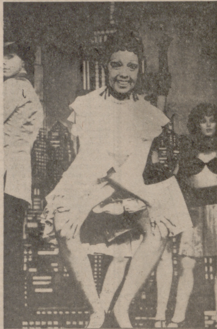
Actuación de Josefina Baker en el espectáculo «Josefina», en la sala Bobino, de París, con el que celebraba sus bodas de oro, en el mundo del espectáculo.