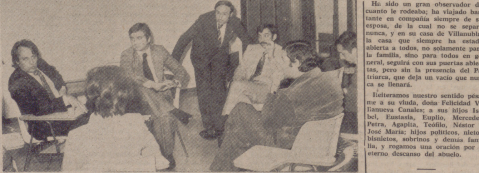
Ayer, en la Delegación que en nuestra ciudad posee la Editorial Plaza-Jarés, el novelista Alberto Vázquez Figueroa presentó sus libros al público, a través de una rueda de Prensa con los medios informativos, y un posterior cocktail, al que asistieron diversas personalidades. En nuestra sección "La Gente" publicamos una entrevista con Vázquez Figueroa.