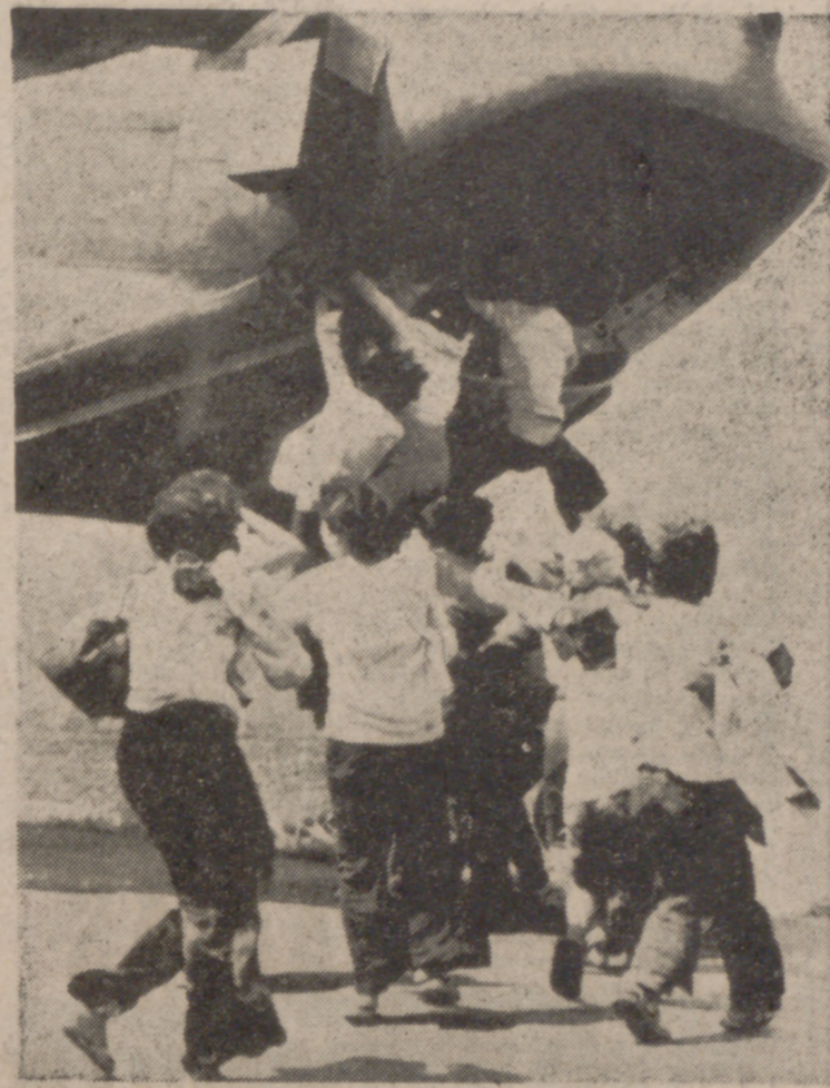
XUAN LOC (Vietnam del Sur).—Refugiados proceden a embarcarse a un helicóptero por su "panza" para huir de la zona castigada por los comunistas, cuando éste intenta despegar, tras haber dejado alimentos para las tropas que combaten en la región.