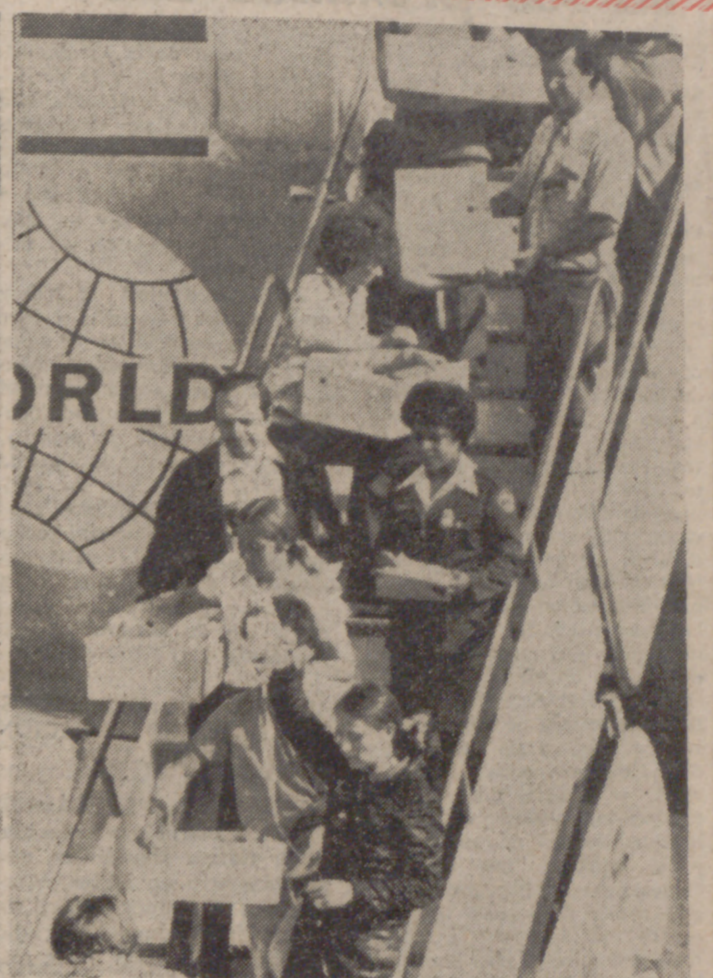
LOS ANGELES (EE. UU.).—Los niños survietnamitas, huérfanos de guerra, son desembarcados de un avión norteamericano en la ciudad de Los Angeles. Todos están heridos, algunos de ellos muy graves, de los 330 que embarcaron en el avión. Un pequeño murió en el viaje.