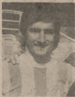
I R U

Pese a que la distancia que todavía mantiene el Racing es sustancial, el empate que el domingo consiguió el Córdoba en el Sardinero ha enfriado un tanto los ánimos a los aficionados montañeses. El ascenso está al alcance de la mano y resulta lógica la alarma cuando se pierde un punto que suponía la tranquilidad y, encima, quien se lo lleva es quien capitanea el grupo de perseguidores. Algo así como lo que le sucedió al Valladolid el domingo, aunque en otro nivel, claro, que aquí el nerviosismo y la preocupación es por no descender.