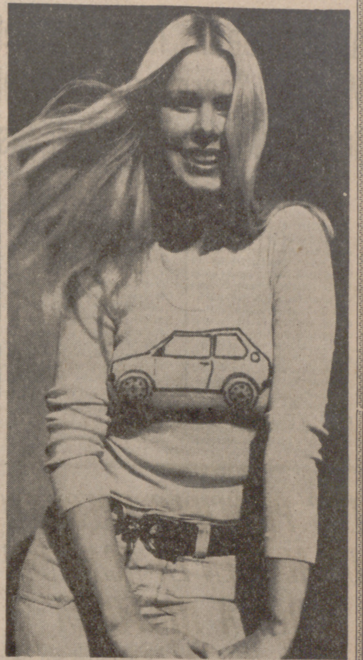
La rubia—a la vista está—es una preciosidad que se gana la vida haciendo publicidad. Ella tiene aptitudes—basta una ojeada para comprobarlo—para anunciar desde un champú para el cabello hasta unos pantalones deportivos, pero no es ni una cosa ni otra lo que la joven y bella modelo sueca trata de popularizar, sino una determinada marca de automóviles cuya silueta lleva impresa en el sugestivo suéter. Lo que está por ver es si los posibles compradores se fijan en el coche o en la rubia. La cosa, a simple vista, no parece tener duda...