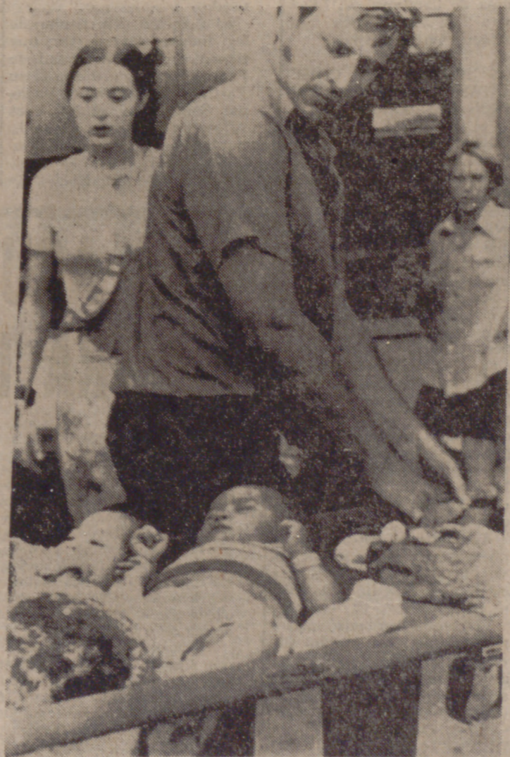
SAIGON.—Dos niños son trasladados en camilla a un hospital. Son supervivientes del accidente del avión «G-S Galaxia» que se estrelló cuando trasladaba a un grupo de huérfanos vietnamitas a los Estados Unidos.

EL PRESIDENTE, ACUSADO DE DIFAMAR A LAS FUERZAS ARMADAS