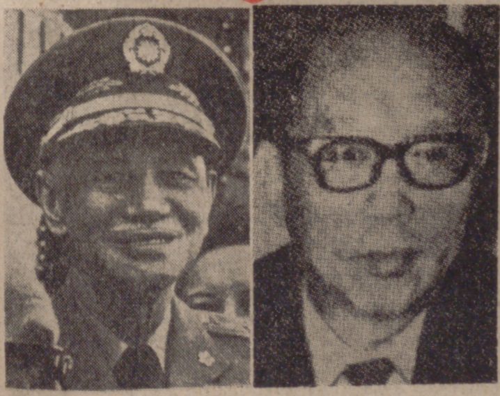
CHIANG KAI-CHEK YEN CHIA-KAN (INFORMACION EN SEGUNDA PAGINA)