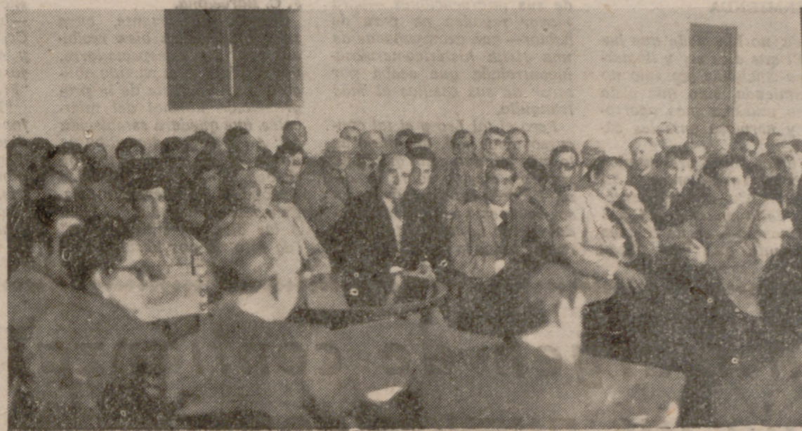
El pasado sábado, en el Centro Social del Movimiento de Laguna de Duero, se celebró una reunión comarcal de Consejeros Locales del Movimiento...