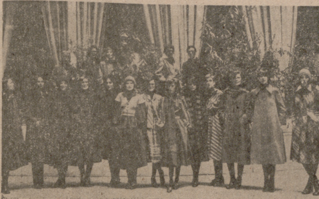
Modelos de «Compramoda Española» otoño-invierno 75-76.

ESTA COMPUESTA POR TREINTA FIRMAS COMERCIALES