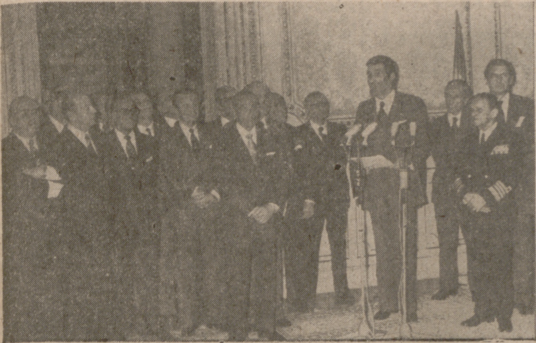
MADRID. — El nuevo Ministro de Trabajo y Vicepresidente tercero del Gobierno, durante el discurso pronunciado en la toma de posesión de los nuevos miembros del Gabinete.

Discurso de Arias Navarro en la toma de posesión de los nuevos ministros