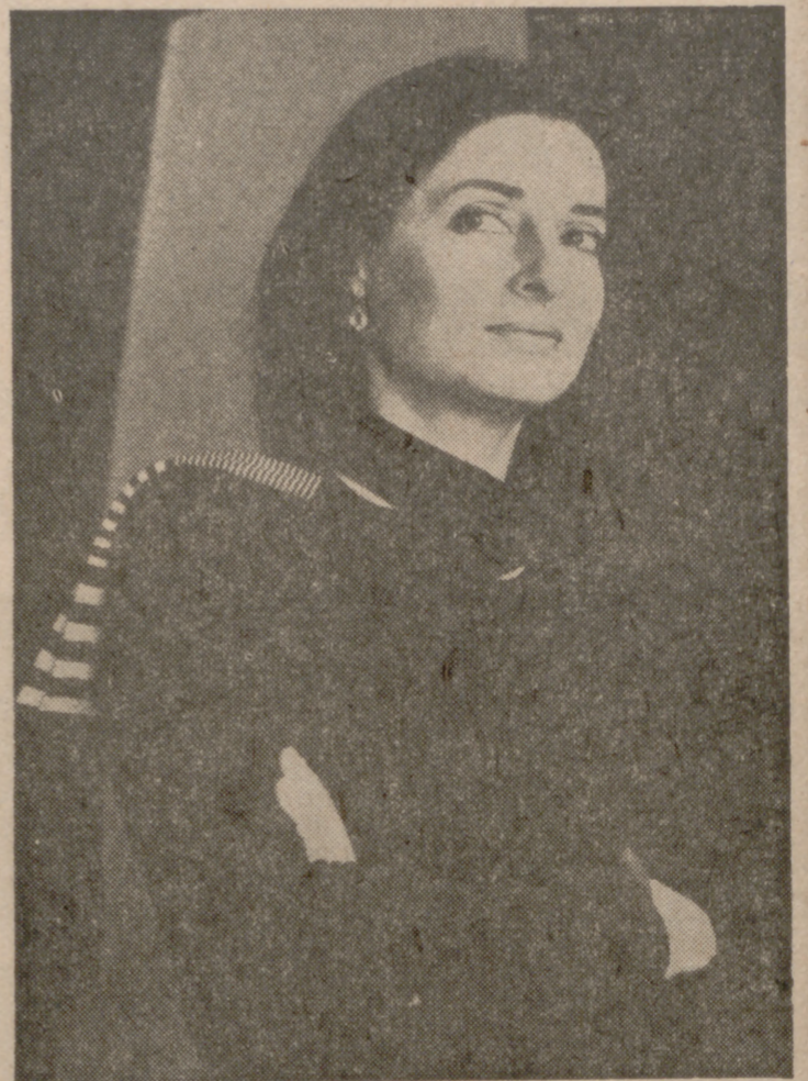
La princesa Elizabeth de Yugoslavia en la tienda de antigüedades que posee en Londres, cuyas ventas han aumentado gracias a la popularidad de su breve romance con el actor Richard Burton.