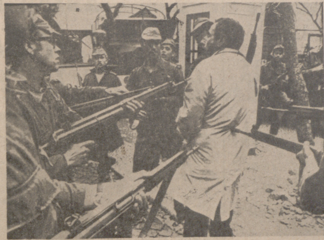
AMSTERDAM. — «Detención de un miembro del PIDE en Lisboa. Abril 1974», es el título de esta fotografía, captada por Henri Dureau, de Francia, que ha ganado el primer premio en la categoría de informaciones gráficas espontáneas en un concurso de «World Press Photo Holland». — (Telefoto Cifra Gráfica-Upi.)