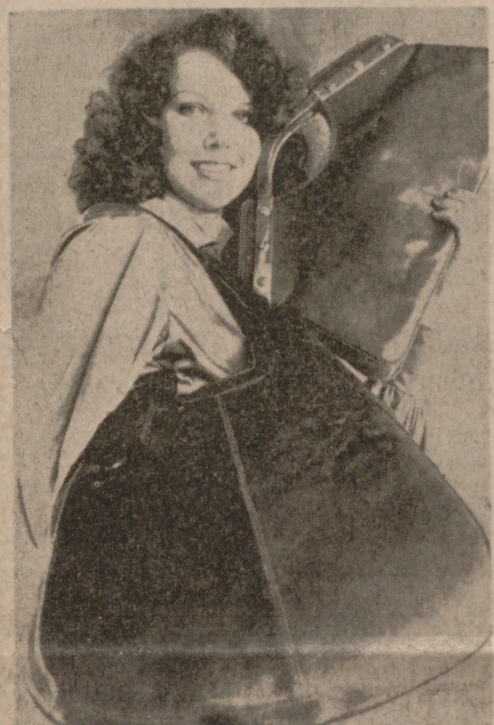
OFFENBACH (Alemania).—Una joven modelo exhibe la nueva moda de bolsos femeninos, creada en la Feria Internacional del Cuero, inaugurada el sábado en Offenbach. Los fabricantes esperan un rotundo éxito para este modelo, denominado "para la compra", para la temporada de primavera y verano, confeccionado en piel de ternera.