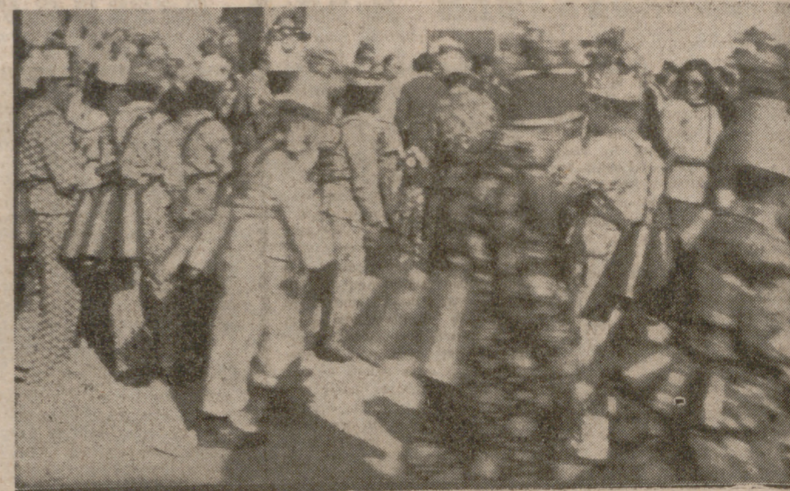
El rito de los Diablos llega a ser, por contagio, colectivo alucinante.

Cuando la campana de la iglesia llama a los Diablos comienza solamente un acto más de los muchos que componen tres agotadoras jornadas. En la