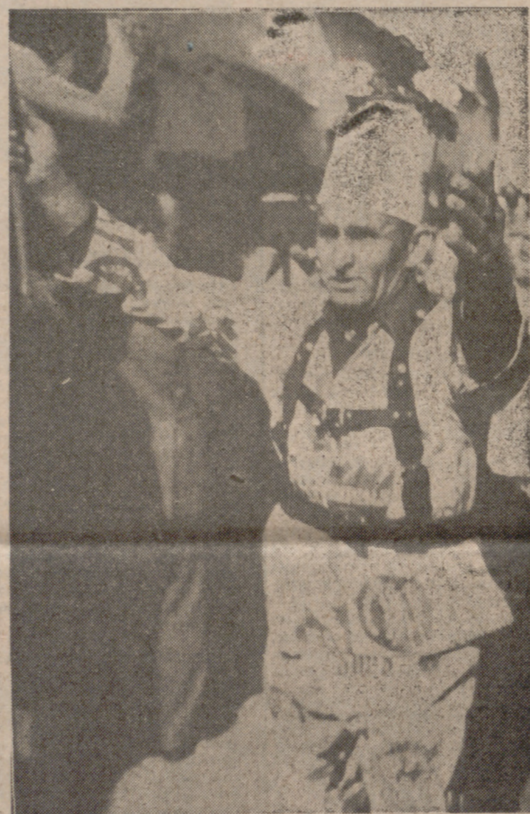
El punto culminante de la danza es la ofrenda, muda, que cada Diablo hace ante la imagen de la Virgen.