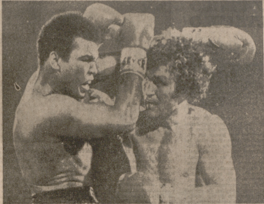
Joe Bugner, titular europeo de los grandes pesos y rival para Cassius Clay, a quien ya se midió una vez.

MADRID, 25 (PYRESA).—De las once categorías de peso que tiene establecidas la Unión Europea de Boxeo, Inglaterra acapara cuatro títulos continentales, con Ken Buchanan (peso ligero), John H. Stracey (peso wélter), Kevin Finnegan (peso medio) y Joe Bugner (peso pesado). En el ámbito mundial, el inglés John Conteh, es el titular de los pesos semimedios.