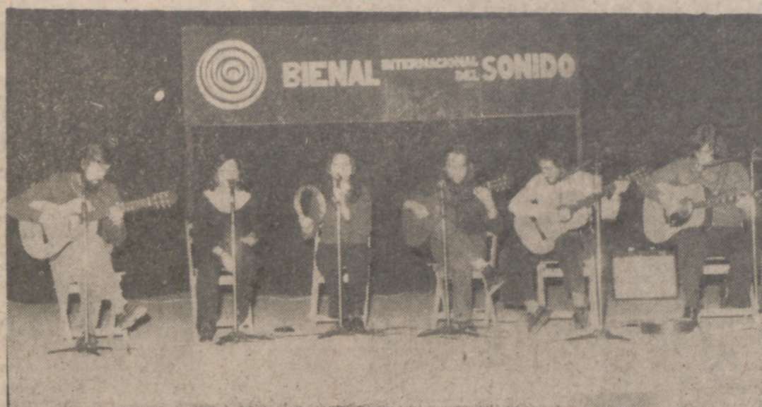
En presencia de las primeras autoridades provinciales y locales, fue inaugurada ayer la II Bienal Internacional del Sonido, en un acto celebrado en la Caja de Ahorros Popular. Antes, en el Teatro Valladolid, tuvo lugar un maratón musical, con numerosas intervenciones artísticas, entre ellas la del grupo "Jubal", momento que recoge la fotografía.