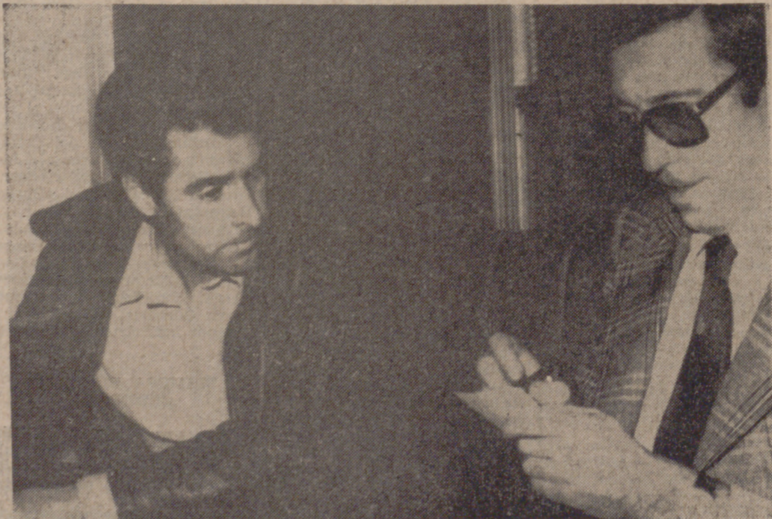
El camionero que quiere dar la vuelta a España en carro.—(Foto PYRESA).

QUE PUEDA VIVIR SU FAMILIA Lo tiene todo perfectamente calculado, hasta los días que invertirá en el lento periplo: ciento ochenta y tres. Pero vamos a saber más detalles. —¿Qué cantidad necesita? —Unas setecientas veinte mil pesetas, todo incluido. —¿Qué incluye? —Los gastos del viaje y la manutención de mi mujer y mis dos hijos. —¿Y de dónde piensa sacarlo? —Ahí está el problema. Creo que algunas empresas podrían colaborar. Cuento con algunos que, dentro de sus posibilidades, ya se han ofrecido. SITUACIONES ANGUSTIOSAS Expone su proyecto con