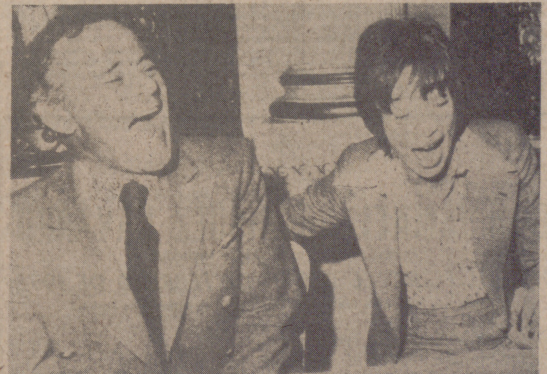
Hay quien cumple el medio siglo con un gesto de tristeza que no puede ocultar. Otros, sin embargo, llegan a los cincuenta años con una carcajada, como en el caso de Jack-Lemmon, que aparece en la fotografía con Shirley McLaine, a quien contagia también esa risa abierta y sonora, aunque no se oiga.