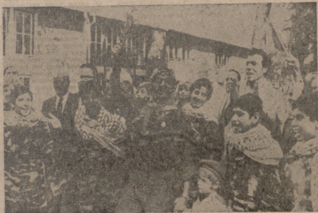
Yasser Arafat, jefe de la Organización de Liberación de Palestina.