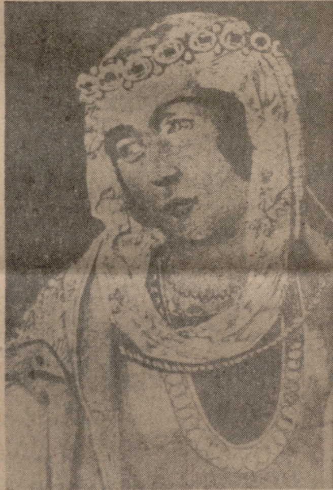
JUANA LA BELTRANEJA