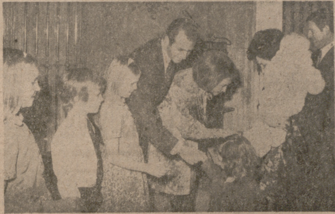
MADRID.—Una comisión del Comité Ejecutivo de la Feria Internacional del Juguete visitó ayer a los Príncipes de España, a quienes acompañaban también sus hijos, los infantes Felipe, Elena y Cristina, haciéndoles entrega de juguetes de Reyes, que fueron distribuidos para la población infantil del personal que se encuentra al servicio de Sus Altezas. En la foto, los Príncipes reciben a los niños entre quienes fueron repartidos los juguetes.