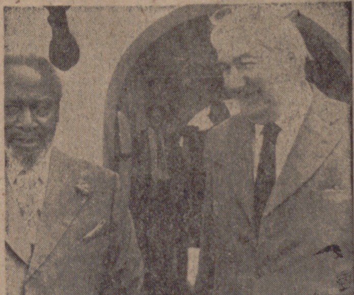
MOMBASSA (Kenia).—El secretario británico del Foreign Office, James Callaghan, que visita Kenia, aparece en la fotografía durante la reunión mantenida en Mombassa con el Presidente de este país, Jomo Kenyatta.