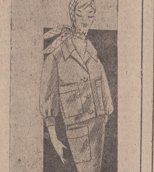
El algodón ofrece, asimismo, la particularidad de que puede llevarse igual para calle que para los demás sofisticados night clubs de Europa. Traje chaqueta realizado en gabardina de algodón azul, con pespunte que recuerdan el popular tejido. Modelo adecuado para un informal fin de semana en el campo, presentado por "Patrones 5 Tallas", bajo el tema de "Sea usted misma su modista".