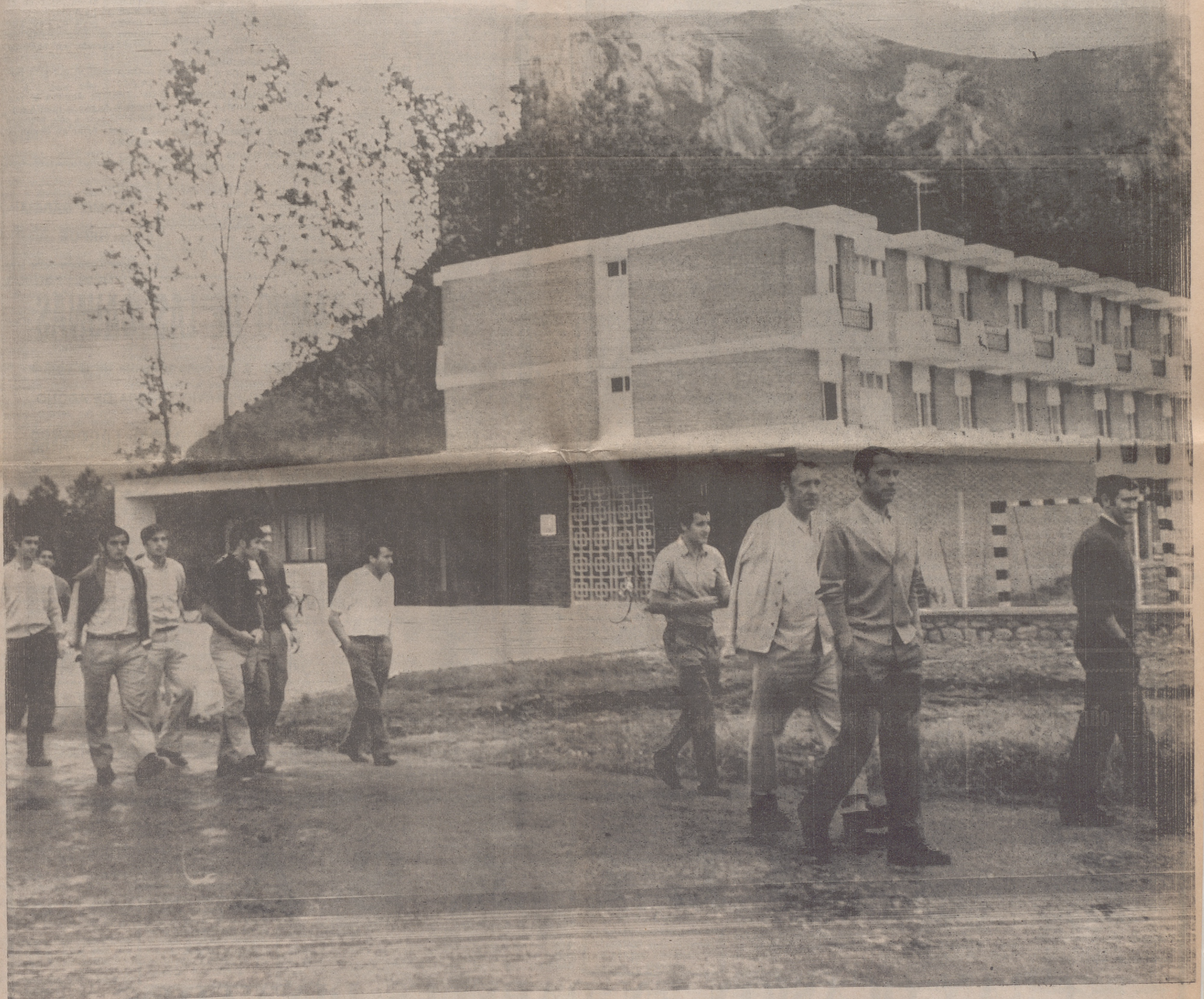
Los jugadores del Logroñes, con el entrenador, salen del hotel de Ezcaray para dar un paseo por la localidad.