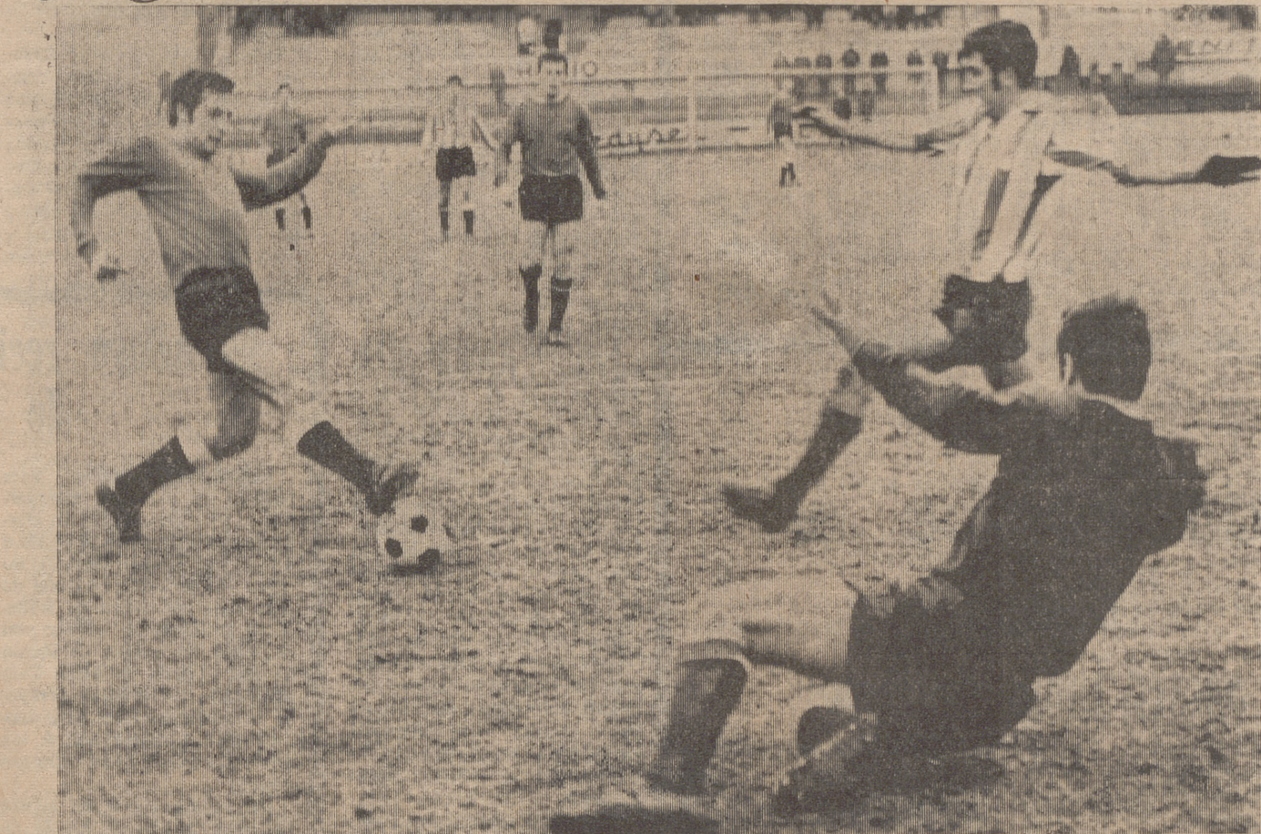
He aquí una de las intervenciones que tuvo Villa en el encuentro amistoso realizado el pasado jueves entre el Logroñés y el Burgos.

—Es difícil encontrar un jugador que supere a Corcuera y más difícil es hallar un jugador ya hecho, que sería lo interesante. Lo más probable es que el muchacho que en-