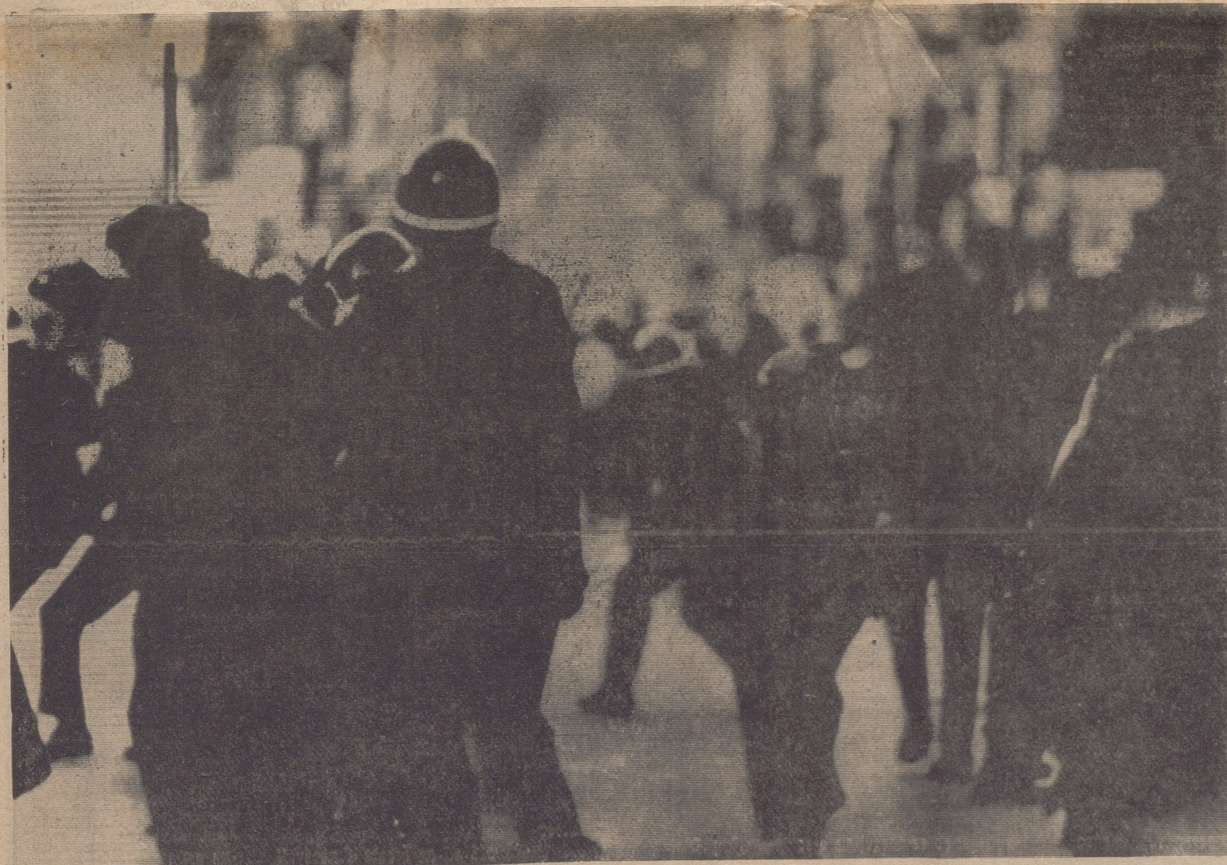
Los males en EE. UU. no vienen solos. Al presidente Nixon, la tarea interior es tan grave como de puertas para afuera. Acallar las voces de protesta por la guerra del Vietnam y demás conflictos en que están mezclados los infantes marines es duro y penoso. Pero hacerse con las riendas del orden en ese vastísimo país que es USA no es misión para envidiarle. Otra vez, los disturbios estudiantiles han florecido en la bella California. Otra vez, la intranquilidad y desasosiego en la conciencia norteamericana. — (Foto «Cifra»).

La labor que les ha sido encomendada está a punto de culminarse. El nuevo Reglamento servirá de cauce para la intensificación de las actividades culturales de diverso signo, tan necesarias en toda la provincia.