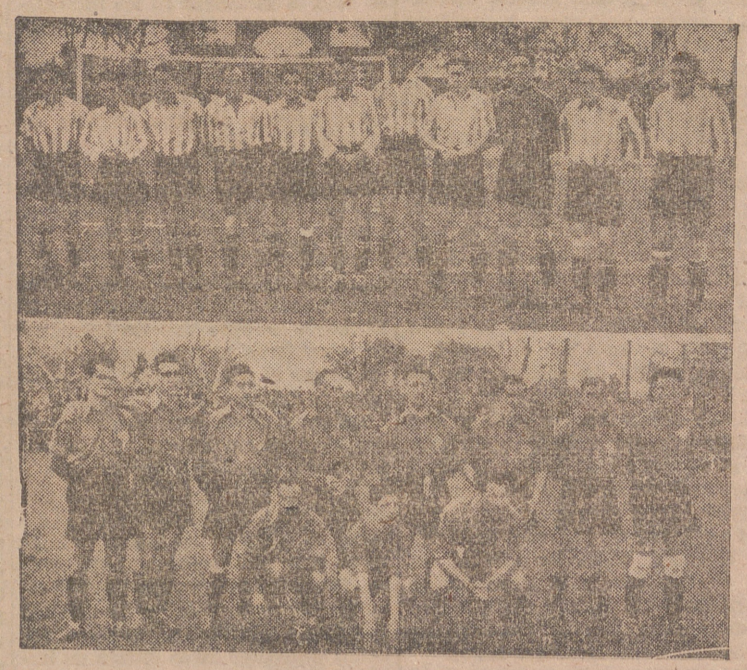
Los equipos del Deportivo Logroñés y Deportivo Maestranza Aérea de Logroño, que el domingo jugaron su primer «encuentro» oficial en la III División de Liga.

En natural contraposición con esos casos de violencias estuvo la escasez de juego. No hubo fútbol. Mejor dicho, apenas si hubo fútbol, el domingo. Tan sólo en contados momentos, aquellos en que la técnica blanquiroja y la defensa más adelantada abrían un paréntesis en los «chirros» y juego subterráneo. Pocos apreciaron algún bien llevado avance y alguna jugada aislada merecedora de atención. El Deportivo Logroñés se alineó en forma que causó general extrañeza. Salva, de medio ala, y Gamboa de exterior derecha, sorprendieron al ocupar esos puestos, pero acusaron inseguridad al actuar de tal colocación, porque uno y otro tuvieron