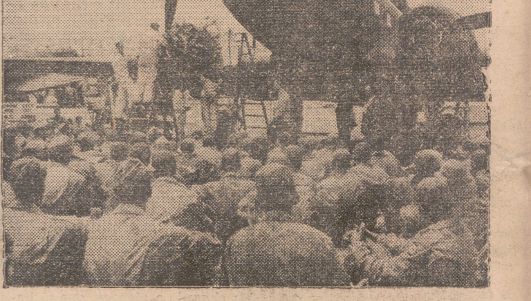
Los hombres contemplan como trabajan los técnicos en un avión de bombardeo, mientras un instructor (en el micrófono) les explica las diversas operaciones.