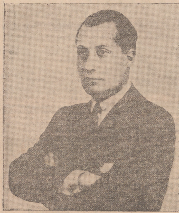
salvar tres veces al pueblo español de los tres mayores peligros que en la moderna historia le han amenazado. De 1933 a 1936, frente a la

Once años son hoy transcurridos desde la Fundación, desde aquel día en que José Antonio alzó, con el encendido verbo de su españolísimo espíritu, la poesía que promete, de la poesía que construye. Y en esos once años de difícil y glorioso caminar de la Falange, se encierra la justificación plena de la misma, se demuestra con riqueza de grandes hechos la necesidad de la Revolución Nacional para la salvación y la grandeza de la Patria.