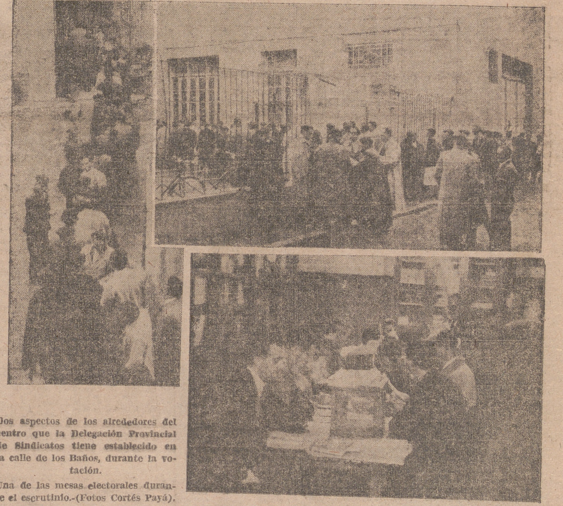
Los aspectos de los alrededores del centro que la Delegación Provincial de Sindicatos tiene establecido en la calle de los Baños, durante la votación.

Los productores riojanos expresan fervorosamente su adhesión a la organización sindical concurriendo en masa a los colegios electorales