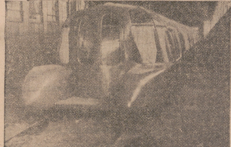
EL TREN ARTICULADO LIGERO, CONSTRUIDO POR TECNICOS ESPAÑOLES