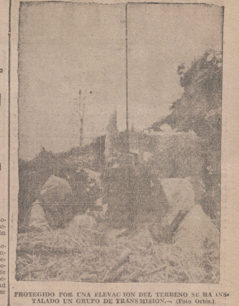
PROTEGIDO POR UNA ELEVACION DEL TERRENO SE HA INSTALADO UN GRUPO DE TRANSMISION.

ros enemigos, que no habían conseguido ningún éxito en sus operaciones. Los submarinos alemanes, en el curso de una dura lucha en el Atlántico del Norte y en el Mediterráneo, han hundido diez barcos, con un desplazamiento total de 46.000 toneladas, los cuales navegaban en convoy; también han sido hundidos cinco destructores y barcos de escolta. Además fueron derribados tres aviones adversarios.—(Efe.)