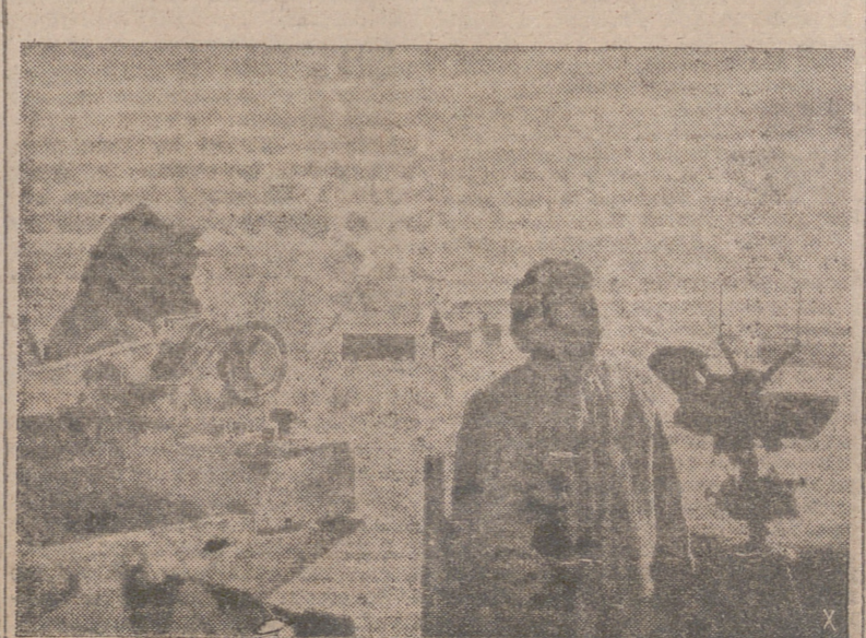
Puesto alemán de vigilancia por medio de aparatos de audición cuya sensibilidad permite recoger el sonido de los motores de la aviación a grandes distancias.