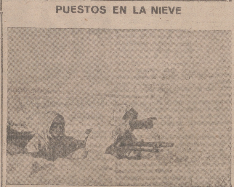
PUESTOS EN LA NIEVE

BERLIN.— La situación militar en el frente del Este es juzgada en los medios militares del Reich con calma y firmeza notables. Se destaca que desde el comienzo de la ofensiva soviética el mando alemán ha dominado ya situaciones muy difíciles.—(Efe).