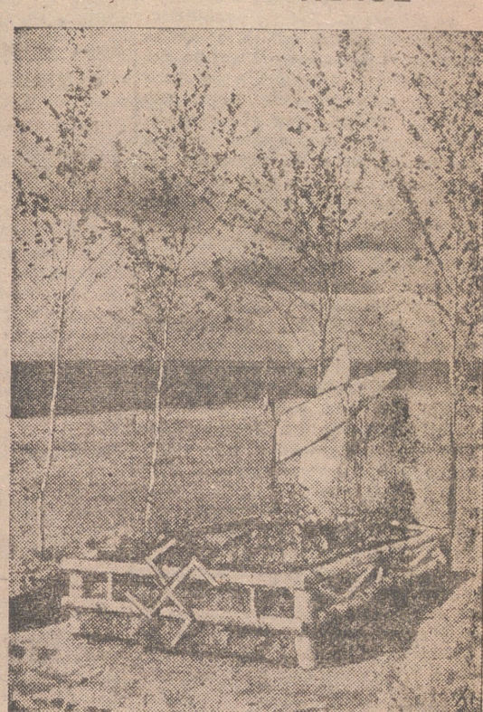
Sobre el frío paisaje estepario resalta la tumba de un heroico aviador cazador alemán muerto gloriosamente en el Este. El grabado nos ofrece ese impresionante espectáculo.