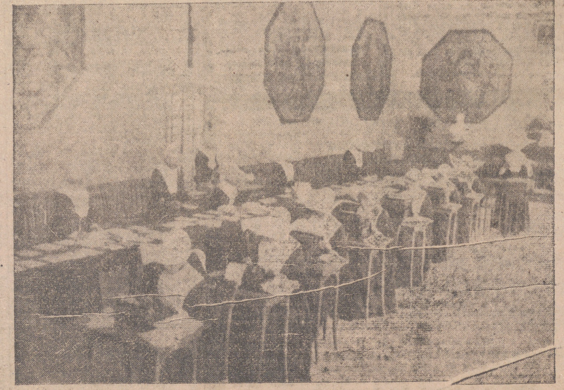
Los Hermanos de la Caridad redactan en la Oficina de Información cartas de contestación para las familias de los combatientes presos en territorio enemigo.