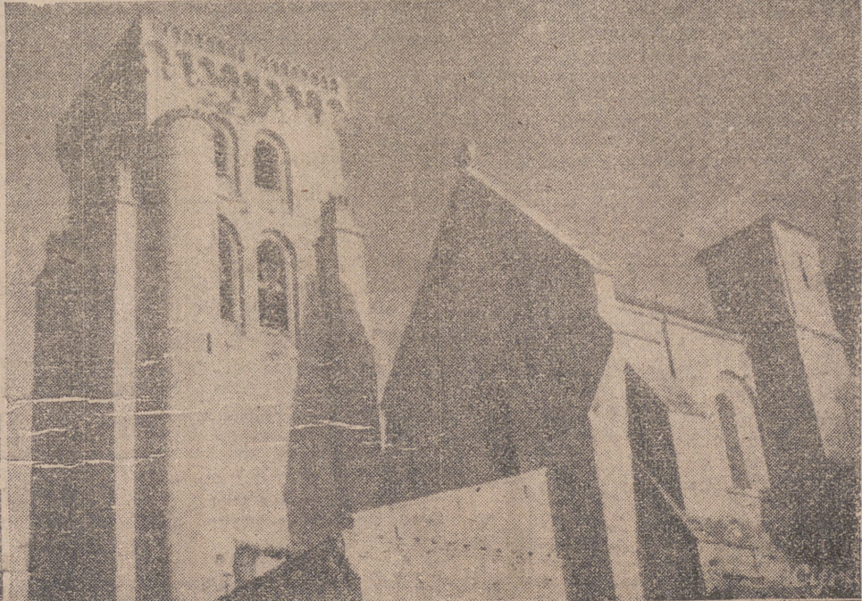
VEJOS CASTILLOS QUE EVOCAN LA HISTORIA DE CASTILLA. — (Foto Cifra.) EL REAL MONASTERIO DE LAS HUELGAS, RECUERDO VIVO DE LA CASTILLA HISTORICA. — (Foto Cifra.)