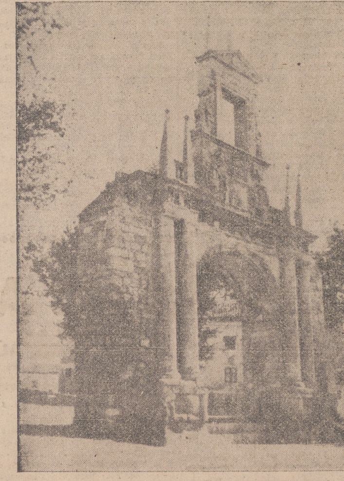
EL ARCO DE FERNAN GONZALEZ, EN BURGOS.