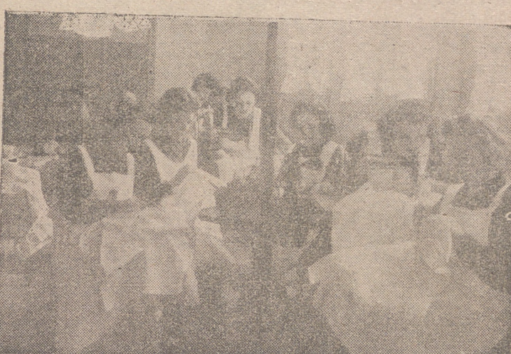
Camaradas trabajando en la confección de canastillas.

ARTESANIA. —Se cuenta con 10 camaradas visitantes de Hogar Artesano que distribuyen a los artesanos las materias que precisan para la confección de sus obras.