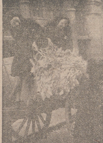
RECOPILACION DE PAPEL. Tres de nuestras camaradas en el momento de cargar una de las redes.

de papel en el mes de octubre, ya que se eleva a 218 kgs. y en el mes siguiente, es decir el pasado noviembre, se obtiene la más elevada cantidad