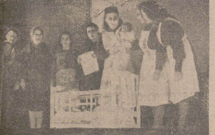
Simpático y emocionante momento del reparto de canastillas. (Foto Cortés Payá).

— Cuatro de Balón-Cesto, dos con Vitoria, uno con Burgos y otro con las camaradas de C. N. S. De