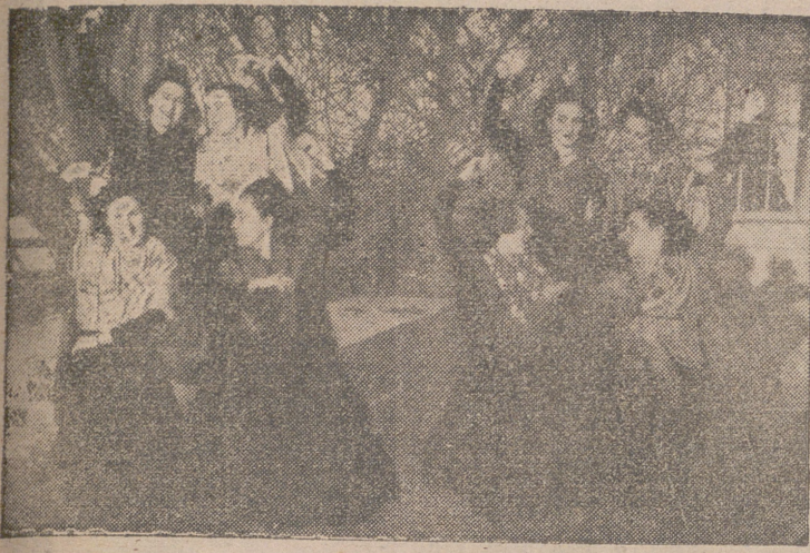
Camarada de la Sección Femenina interpretando la jota riojana. (Foto Cortés Payá).

No intentamos, al publicar esta información, poner de manifiesto toda la labor que la Sección Femenina de F. E. T. y de las J. O. N. S. ha desarrollado en el transcurso del año 1942, ya que sería preciso disponer de un mayor espacio (y tiempo por añadidura) para exponer la maravillosa y difícil tarea que con tanto acierto y esfuerzo ha desempeñado a todo lo largo del pasado año. Dada, pues, esta limitación, sólo mencionaremos aquellos aspectos más interesantes —por el fruto recogido— en cada una de las distintas Regidurías que integran la Sección Femenina.