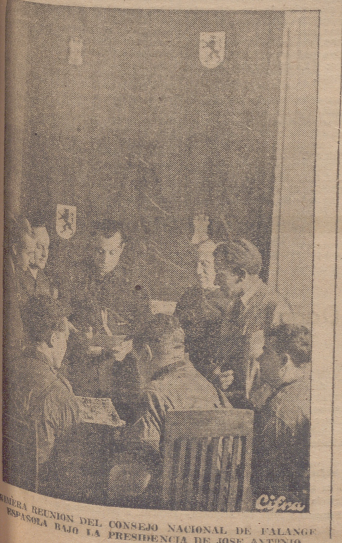
PRIMERA REUNION DEL CONSEJO NACIONAL DE FALANGE ESPAÑOLA BAJO LA PRESIDENCIA DE JOSE ANTONIO