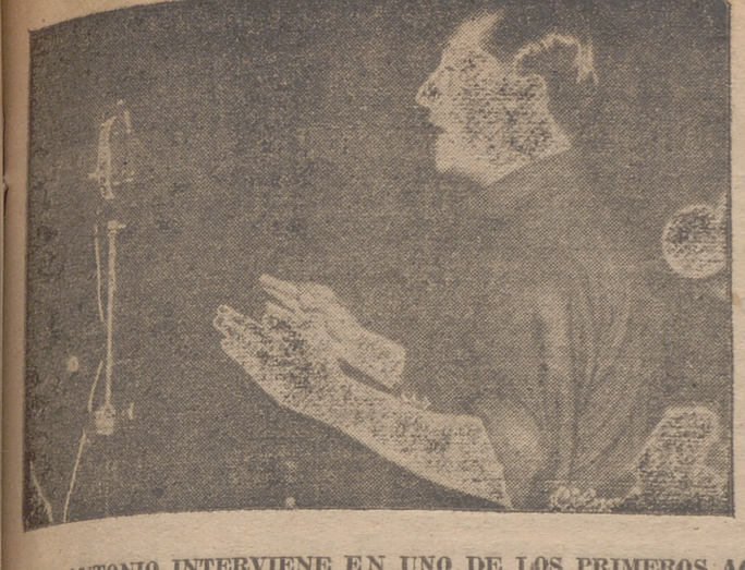
JOSE ANTONIO INTERVIENE EN UNO DE LOS PRIMEROS ACTOS DE LA FALANGE