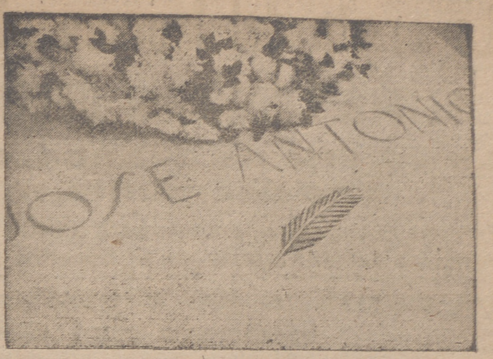
SOBRE LA LOSA QUE CUBRE LOS RESTOS DE JOSE ANTONIO EN EL ESCORIAL, LA PALMA DE ORO COLOCADA POR EL CAUDILLO