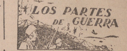
LOS PARTES DE GUERRA