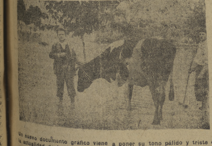
Un nuevo documento gráfico viene a poner su tono pálido y triste en la actualidad de las inundaciones en la huerta murciana. En la "foto" aparecen dos huertanos poniendo a salvo a sus animales.

ORIHUELA, 25. — El Seguro vuelve casi a su cauce normal. El aspecto de la ciudad es desolador, lleno de barracas. La huerta ha sufrido daños importantísimos, sobre todo en los remansos, que han quedado cubiertos de arcilla, y que inutiliza los campos para el cultivo durante largo tiempo. (Cifra). LABORES DE LIMPIEZA CARTAGENA, 25. — La Brigada municipal continúa día y noche la limpieza de las zonas