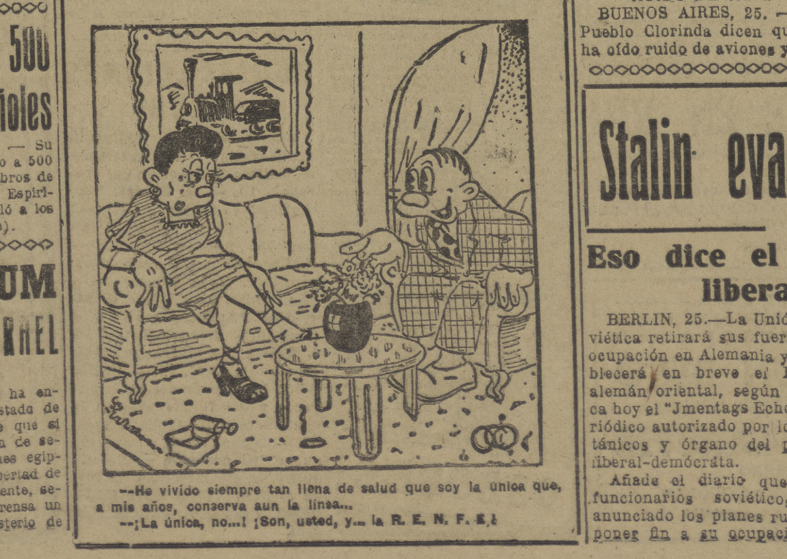
—He vivido siempre tan llena de salud que soy la única que, a mis años, conserva aun la línea... —¡La única, no! ¡Son, usted, y... la R. E. N. F. E.!