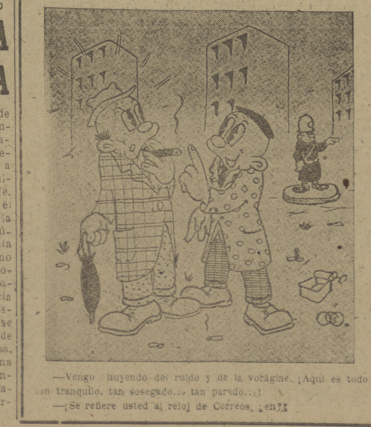
—Vengo huyendo del ruido y de la vorágine. ¡Aquí es todo tan tranquilo, tan sossegado... tan parido...! —Se refiere usted al reloj de Correos, ¿eh? —