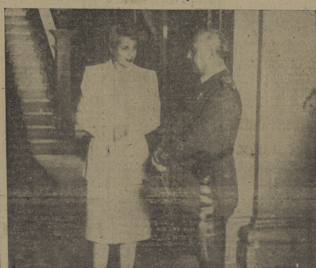
Doña María Eva Duarte de Perón, saluda a S. E. el jefe del Estado a su llegada al Palacio de Pedralbes, donde se alojaba la distinguida dama argentina.