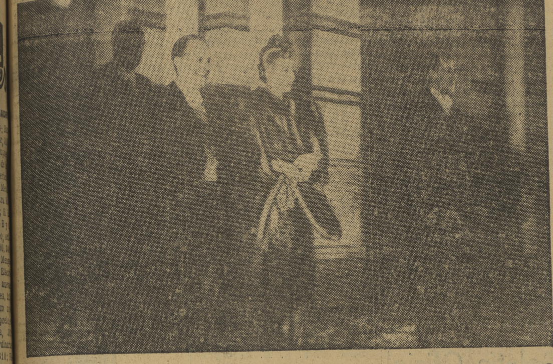
Doña María Eva Duarte de Perón, acompañada de los ministros de Justicia y Agricultura, al salir del Pabellón Real, en sus visitas efectuadas en Sevilla.

NUEVA YORK, 19. — Ha quedado resuelta la huelga marítima, que afectaba a las costas del Atlántico y del golfo de Méjico. Los sindicatos han aceptado un aumento. (Pasa a última página).