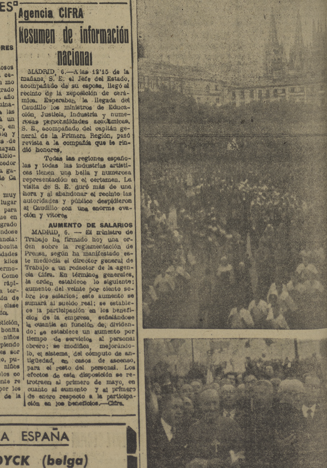
LA VISITA DE FATIMA Un aspecto de la imponente muchedumbre. — Las primeras horas burgalesas honra a la Virgen de Fátima.

Un aspecto de la imponente muchedumbre. — Las primeras horas burgalesas honra a la Virgen de Fátima.