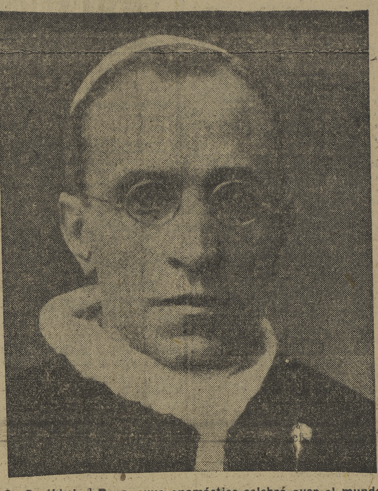
Su Santidad el Papa, cuyo onomástico celebró ayer el mundo católico. El Santo Padre pronunció con este fausto motivo un trascendental discurso que fué traducido a varios idiomas, y entre ellos, a castellano. En esta fecha tan señalada para todo buen cristiano hacemos patente, una vez más, nuestra fe católica, a la vez que elevamos nuestras oraciones por las intenciones del Sumo Pontífice

No temáis! todos los creyentes deben depositar su confianza en Dios, dijo el Santo Padre