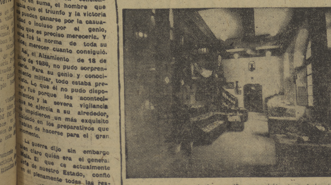
He aquí un aspecto de la magnífica exposición de trabajos instalada por el Frente de Juventudes en la Rotonda del Espolón.