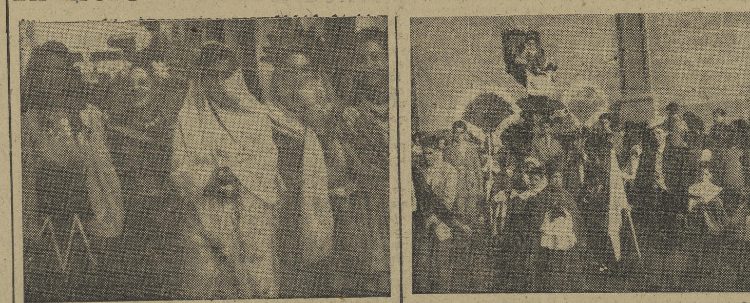
Distinguidas señoritas de "a localidad que figuraban en la gran cabalgata misional celebrada el pasado domingo