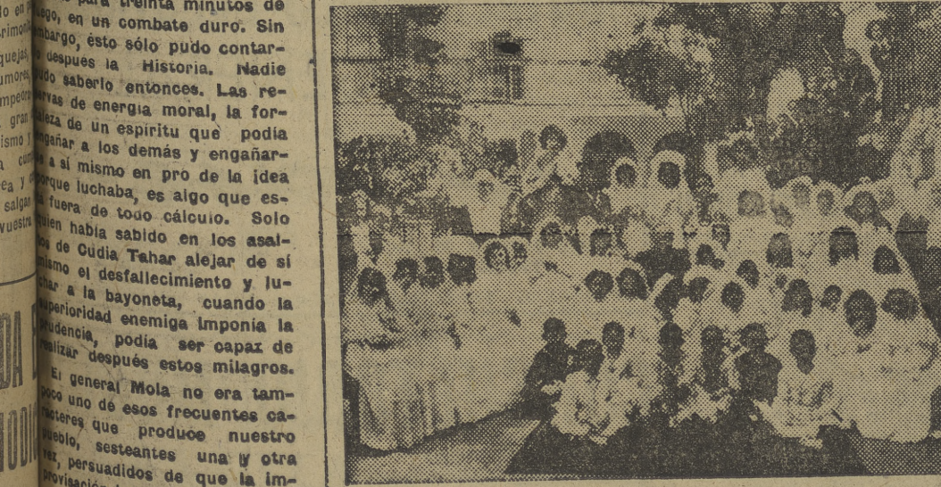
El Excmo. y Rvdmo. señor arzobispo, rodeado de los niños y niñas, en el Colegio Saldaña, que acaban de recibir la primera comunión.