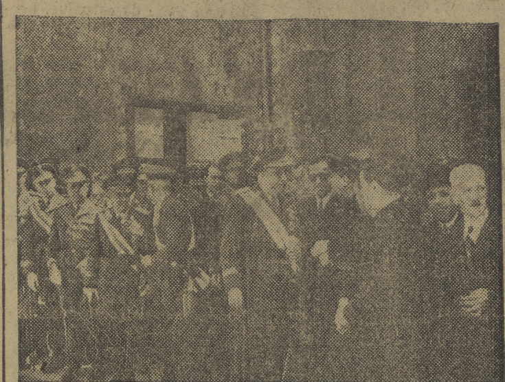
El Excmo. señor capitán general, rodeado de altas personalidades militares, civiles y eclesiásticas, a la salida de la función religiosa celebrada en honor del Santo.