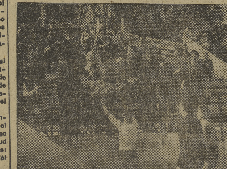
La señorita de Lóstau recibe un ramo de flores del capitán del equipo del Grupo Central de Farmacia del Ejército del Aire, durante el partido celebrado ayer en Laserna.