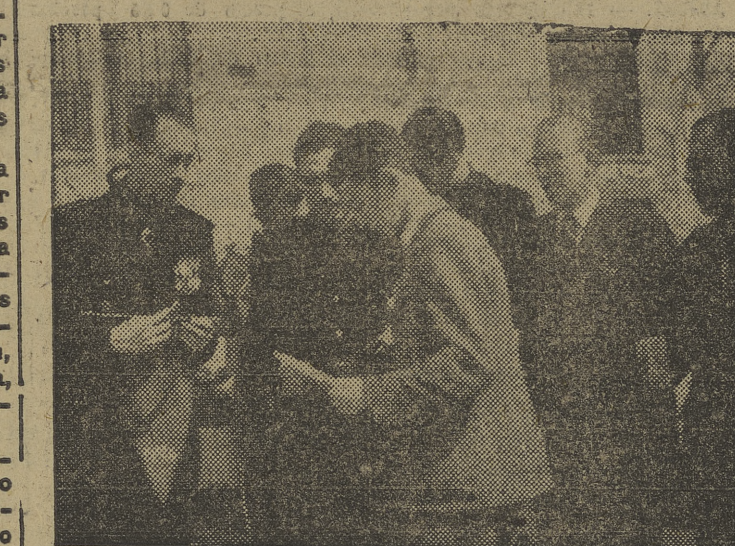
El delegado provincial del Frente de Juventudes, durante el acto de entrega de premios a los escuadristas que más se han distinguido por su conducta, disciplina y méritos durante las últimas competiciones celebradas en nuestra ciudad.