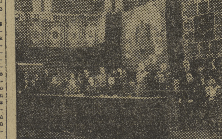
S. E. el Jefe del Estado, recibe en el Palacio Nacional de Montjuich el homenaje de los Ayuntamientos y Diputaciones de Cataluña.