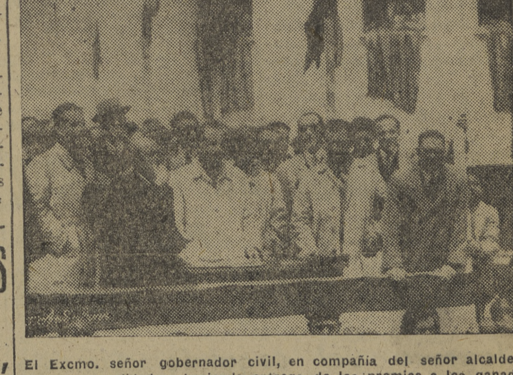
El Excmo. señor gobernador civil, en compañía del señor alcalde y otras personalidades, haciendo entrega de los premios a los ganadores en el concurso de carrozas.