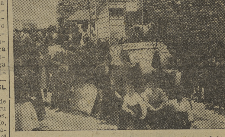
Ayer, fiesta de San Isidro, y en el concurso de carrozas, fue esta "Granja Agrícola" la que obtuvo el primer premio, siendo muy elogiada por los asistentes al acto.