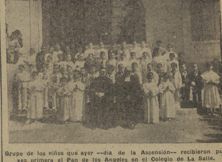
Grupo de los niños que ayer -- día de la Ascensión -- recibieron por vez primera el Pan de los Angeles en el Colegio de La Salle.