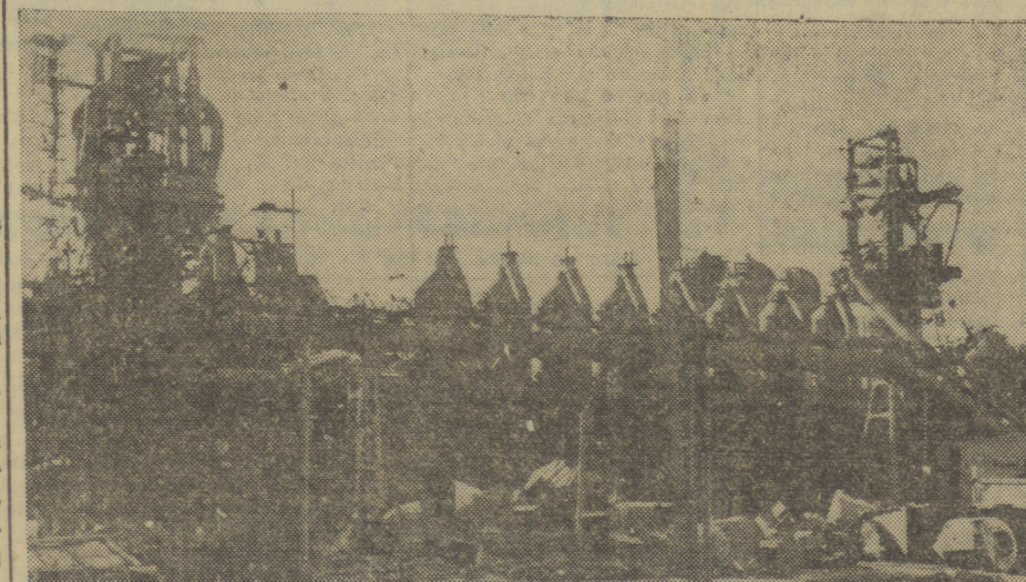
He aquí una de las fábricas de Manchester, destruidas durante la guerra y ya en franca reconstrucción

ATENAS, 4. — La Cámara de Diputados ha concedido un voto de confianza al Gobierno, tras un debate en el que todos los oradores expresaron su indignación por las "injusticias cometidas contra Grecia" en la Conferencia de la Paz que se celebra en París. Efe.