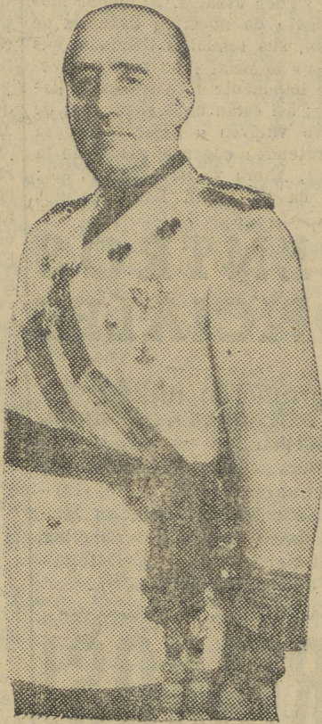
Felicitación al Caudillo. — Cifra.

Como nota simpática del acto es de hacer notar que los fotógrafos de Prensa y operadores del "No-Do" felicitaron personalmente a S. E., el cual conversó varios minutos con ellos, expresándoles su agradecimiento por la labor que realizan.