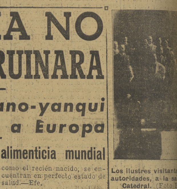
Los ilustres visitantes, en autoridades, a la salita del Catedral.