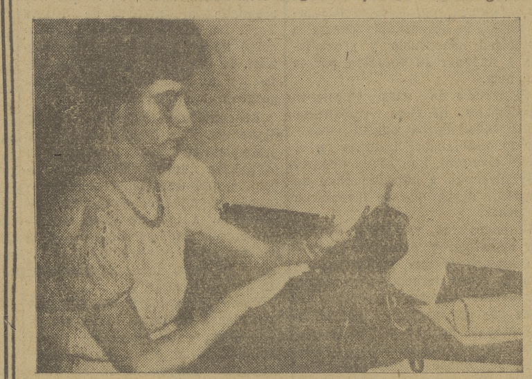
Como puede verse en esta fotografía, el aparato se lleva cómodamente en un bolso de señora

El aparato tiene aproximadamente el tamaño de un aparatito de cine casero, y puede llevarse con toda comodidad en un bolso de señora.