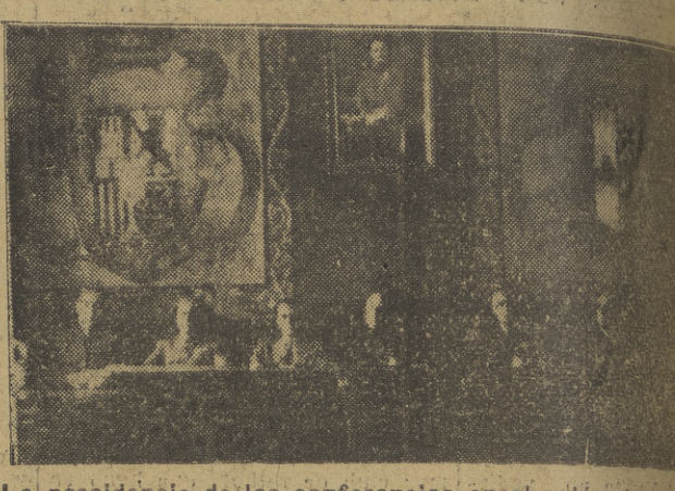
La presidencia de las conferencias en el salón de actos de la excelentísima Diputación Provincial.