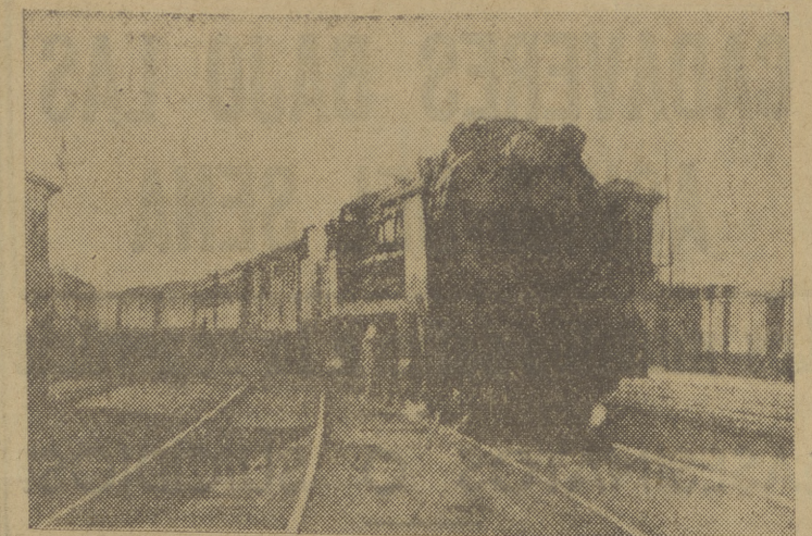
Por eso, en algunas ocasiones cuando en cualquier centro ferroviario Venta de Baños, Alcázar de San Juan o Casad...

tiene un mucho de picaresca verbenera, dan paso el convoy. De estos cuadros ferroviarios han salido más tarde las actuales unidades militares.