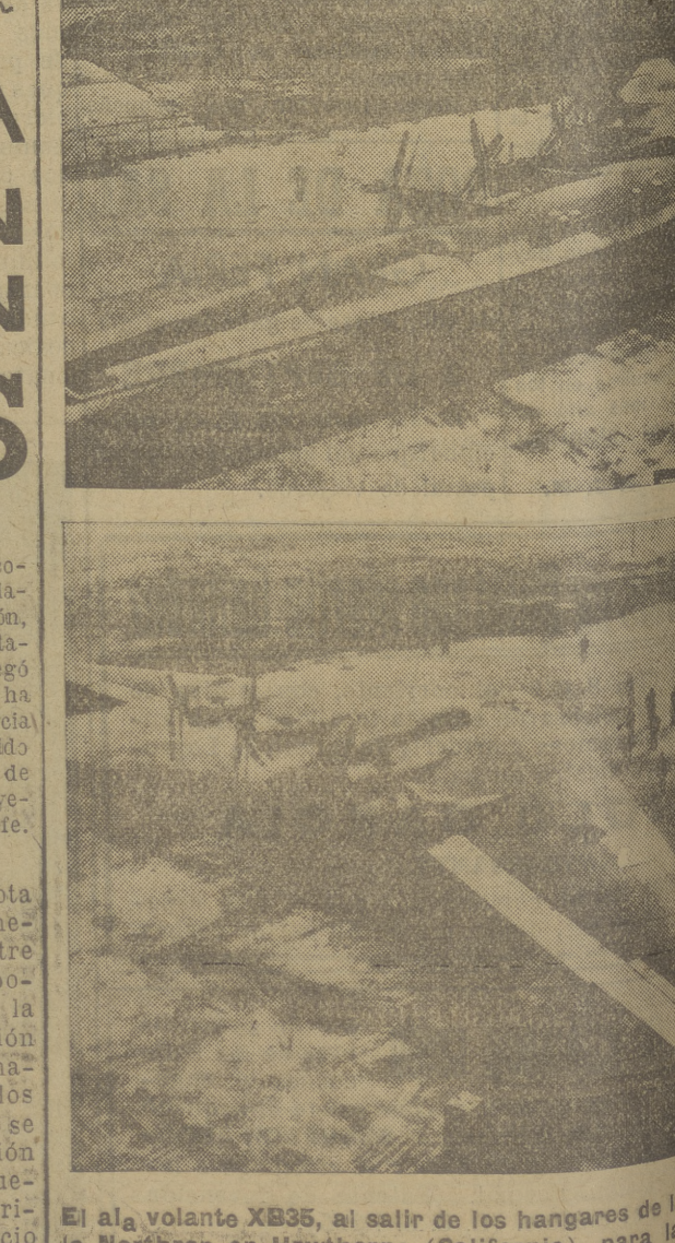
El ala volante XB35, al salir de los hangares de las fabricas de la Northrop en Hawthorne (California), para las pruebas de los motores y hélices en el exterior. Para facilitar el arranque del tren de aterrizaje, de tipo triciclo, va sobre unos patines especiales.