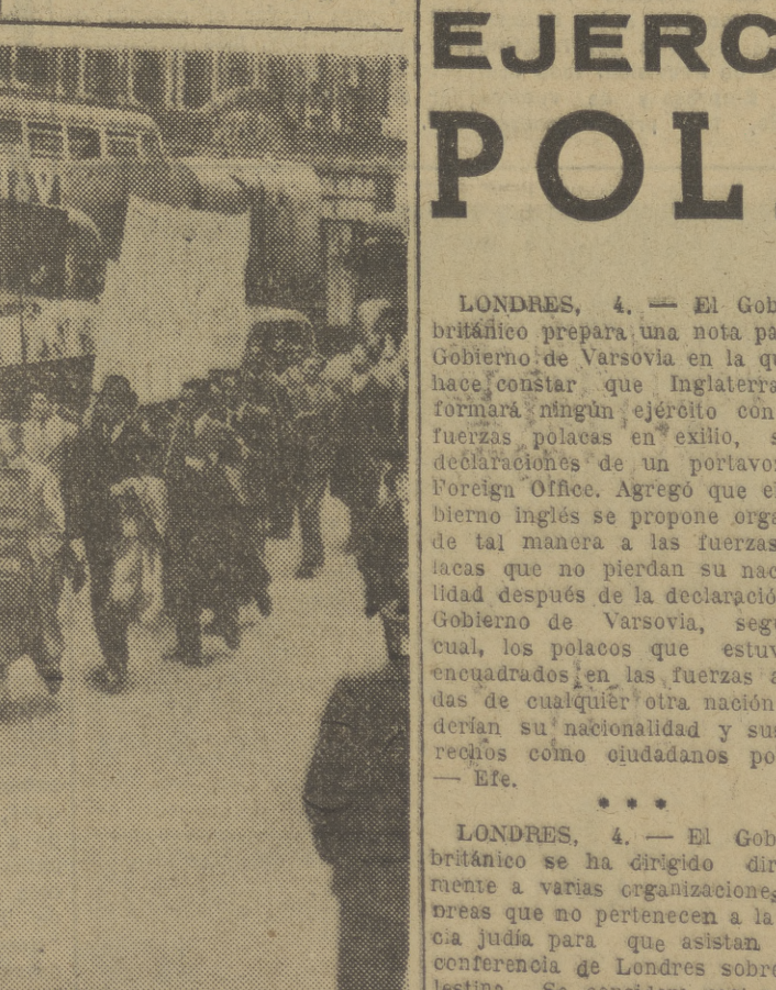
Los partidarios de la Liga Árabe Panindia, que solicitan la autonomía para el Estado del Pakistán, organizaron una manifestación que recorrió las calles de Londres el Día de la Acción Directa.

LONDRES, 4. — Los esfuerzos del ministro del Trabajo británico al tratar de resolver la amenaza de huelga de los mecánicos de las líneas aéreas británicas han fracasado totalmente.