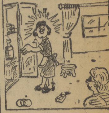
¿Andando en mi armario...? --Me deja usted sorprendida... --Más sorprendida estoy yo, que creí que la señora había salido...