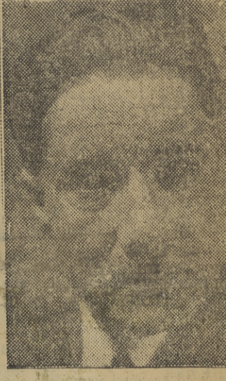
Excelentísimo señor ministro de Educación Nacional

PARIS, 8. — El Observatorio de esta capital ha informado que han sido vistas sobre Francia a una altura de seis mil metros algunas partículas radioactivas que no han sido posibles justificar. Parece que son ondas radioactivas originadas por la explosión de la bomba submarina efectuada en el atolón de Bikini el día 25 del mes pasado o hasta que se deban a fenómenos solares. — Efe. LISTA DEL GOBIERNO COLOMBIANO BOGOTA, 8. — He aquí la lista del nuevo Gobierno formado por el presidente Ospina Pérez: Interior, Manuel Barrera Parra; Asuntos Exteriores, Francisco Umay; Guerra, Luis Tamayo; Hacienda, Francisco Paula Pérez; Educación, Mario Varvajal; Trabajo, Blas Herrera Aspategui; Obras Públicas, Darío Hernández. — Efe. VUELVE A TEMBLAR LA TIERRA EN SANTO DOMINGO CIUDAD DE TRUJILLO, 8. — A las dos de la madrugada de hoy ha vuelto a temblar la Tierra por corto espacio de tiempo, pero con fuerte intensidad. El pueblo, alarmado, corrió presuroso por las calles y las plazas de la ciudad. — Efe.