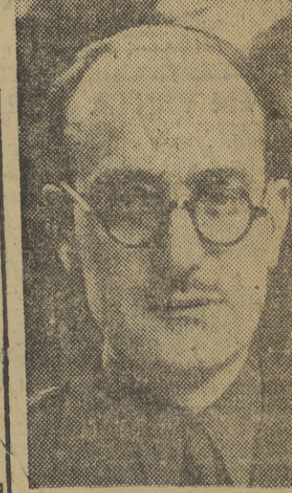
Excelentísimo señor ministro de Agricultura