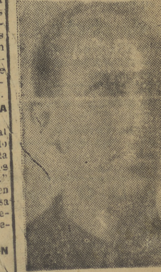
Excelentísimo señor ministro del Ejército

MUÑO (Cal) ha sugerido... tarea humanitaria de "Auxilio Social" y otras entidades... Las niñas que parten hacia los centros veraniegos son atendidas por las muchachas de estos servicios