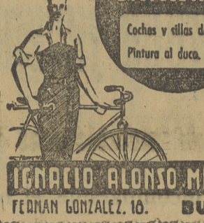
REPARA MUNDI BICICLETAS. Coches y días de auto. Pintura al óleo. IGNACIO ALONSO MIGUEL. FERNAN GONZALEZ, 10. BURGOS

Esta ha sufrido alguna modificación en cuanto a la organización del recorrido con