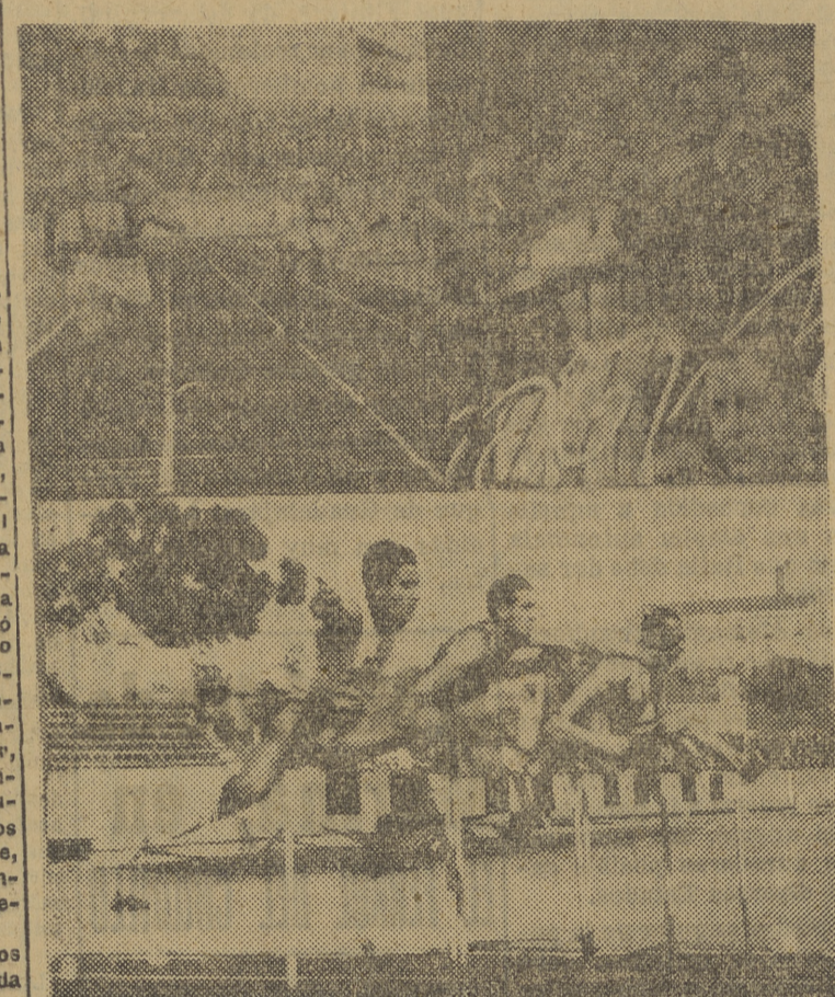
EN SEPTIEMBRE ULTIMO, ESPAÑA PERDIO EN LISBOA. Este año, el equipo nacional ha conseguido la revancha en Barcelona. En la foto, llegada de los 400 metros; las autoridades, y llegada de los 110 metros valias.