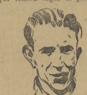
OLMOS Vencedor del I y II Gran Premio Fútbol Sobremesa

El presidente del comité organizador, colmó de elogios la figura del ex-defensa internacional. Quedes contestó diciendo que de ninguna manera, que el mérito era