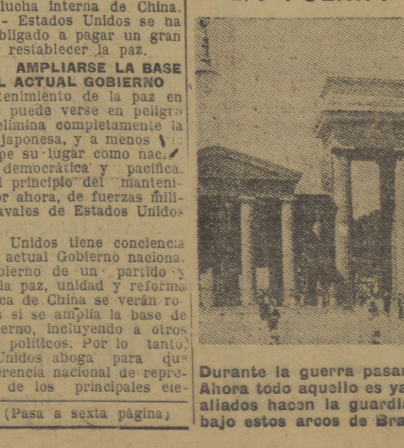
(Pasa a sexta página)

TEHRAN, 15. — Se confirma la caída de Tabriz en poder de los rebeldes, comunica un cable de la Reuters, el cual añade que esta ciudad, que es una de las más importantes de la provincia de Azerbaiján, en el norte de Irán, ha sido tomada por los rebeldes. El asedio comenzó el día 10, cuando las fuerzas aliadas, con el Comandante Mayor del ejército de Tabriz, que se negaba a abandonar la ciudad, fueron obligados a retirarse. El general Agha Jafar, jefe del ejército aliado, se ha retirado a la ciudad de Urmia, donde se encuentra el cuartel general de la guerra en Irán. Se comenta que el general Agha Jafar, ministro de Guerra, se encuentra en una conversación con el Comandante Mayor de Tabriz, se encuentra también presente Bahá, ex-gobernador general de Tabriz, que había regresado a Teheran en avión cuando los rebeldes declararon autonomía a la región, el cual arguyó contra las luchas callejeras en la capital de Azerbaiján, pues, según dijo, sería suficiente que algún ruso resultara incidentalmente herido para que las autoridades militares soviéticas tomaran serias represalias. Los rebeldes se han apoderado de grandes depósitos de armas y municiones. Se teme que se rindan las demás guarniciones de la provincia con la caída de Tabriz, se comenta. La conferencia de Moscú, al tratar la cuestión del Irán se encontraba como un hecho consumado.—Efe.