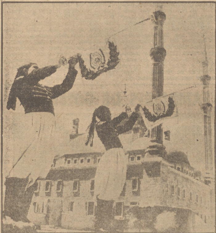
Soldado vistiendo el uniforme de los tiempos de Mohamed Ali, fundador de la dinastía actual, tocan las cornetas mientras la ceremonia.