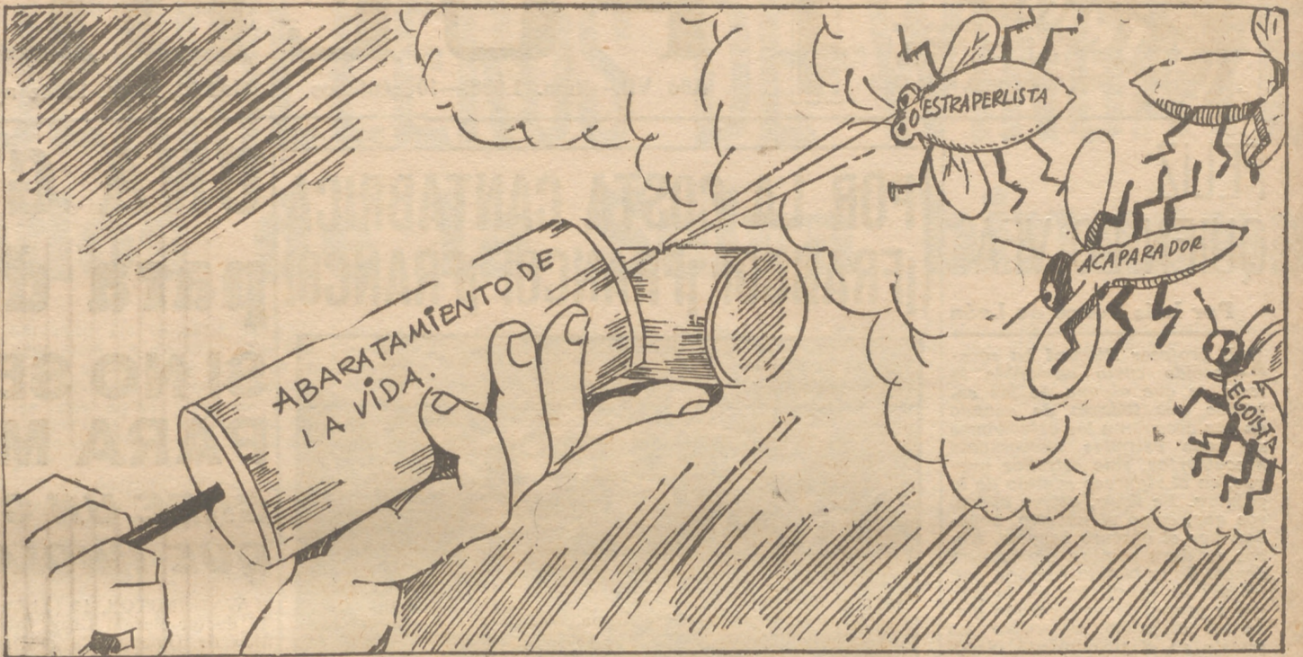
Hay que terminar con los parásitos.