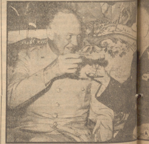
El general Eisenhower brinda con el Presidente Dutra, en el Palacio Presidencial de Río de Janeiro. Dutra ministro de la Guerra, antes de ser el jefe del Estado, fué instructor de las fuerzas brasileñas que lucharon bajo el mando del general Eisenhower.