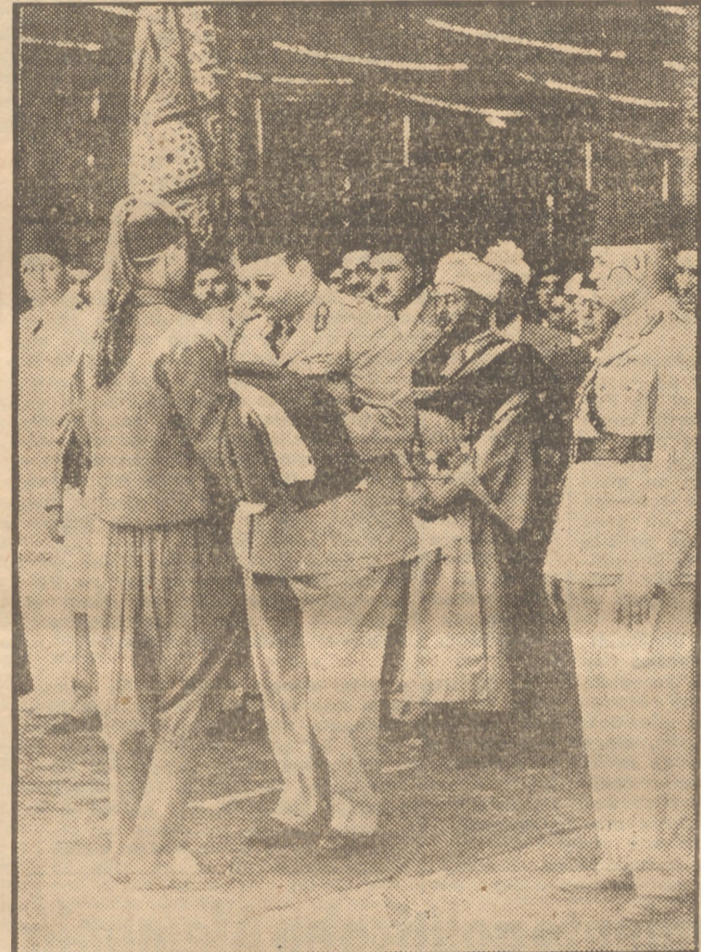
El día 9 de agosto de 1946 es una fecha memorable en la historia de Egipto; ese día el Rey Faruk izó la bandera de su país sobre la ciudadela del Cairo, que ha sido abandonada por las fuerzas británicas después de 64 años de ocupación. El acto revistió un esplendor típicamente oriental. Los cañones dispararon salvas y los aviones volaron sobre la ciudadela mientras el Rey, que actualmente tiene veintisiete años y que vestía uniforme del Ejército egipcio, besaba la bandera antes de izarla. Representantes de otros Estados árabes, entre ellos Irán y Afganistán, estaban presentes. En la foto se ve al Rey, con gafas negras, al ir a besar la bandera.