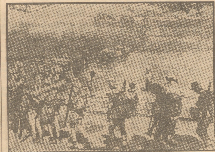
Los guerrilleros atraviesan un río.

mo voluntario para volver al país como cocinero de los oficiales. Wingate se sentó en un baúl, sorbiendo su té en un deteriorado cazo de estaño y sacando ciruelas de una lata con sus dedos. Llevaba una usada camisa de campaña, unos pantalones de pana burda y un anticuado casco colonial, en forma de cesto. Aquel casco—una reliquia de la campaña de Etiopía—era un fetiche de Wingate, quien no podía separarse de él. "Sin él—observaba uno de sus oficiales—creo realmente que el