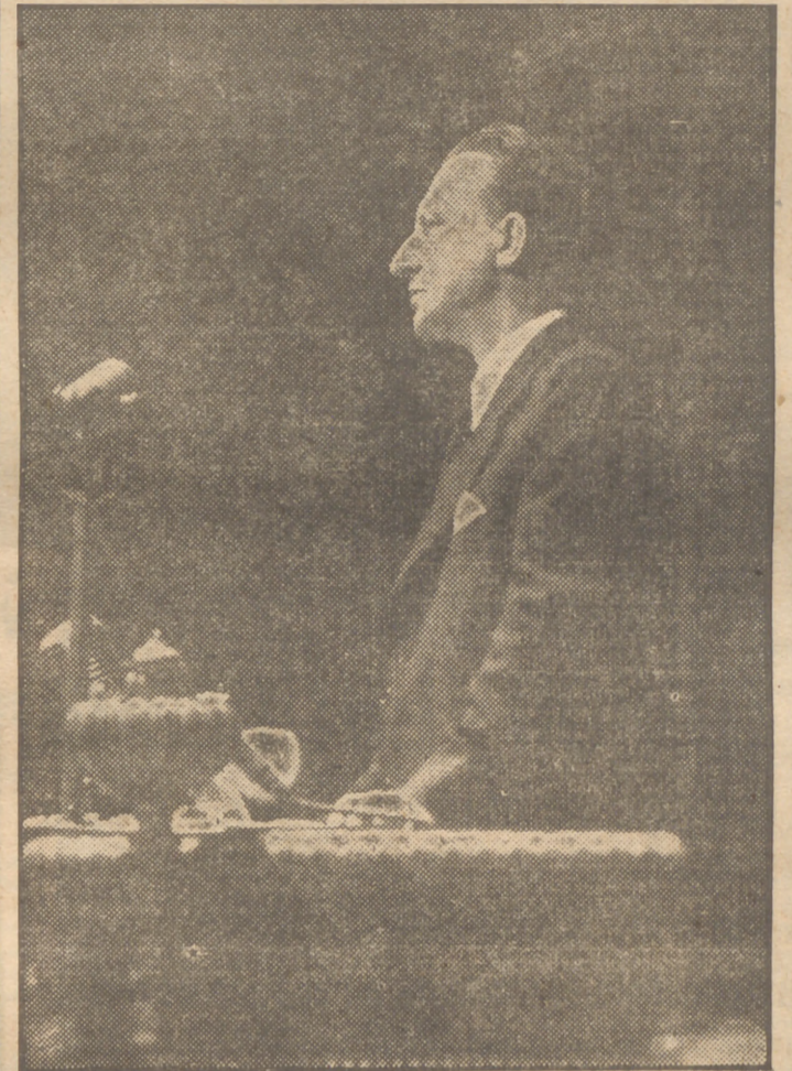
El primer ministro italiano, señor Alcide de Gasperi, expuso ante la Conferencia de París el desagrado de su nación por la dureza de las condiciones de paz impuestas a Italia. El señor De Gasperi al pronunciar su discurso abogando por la dulcificación de los términos de paz.