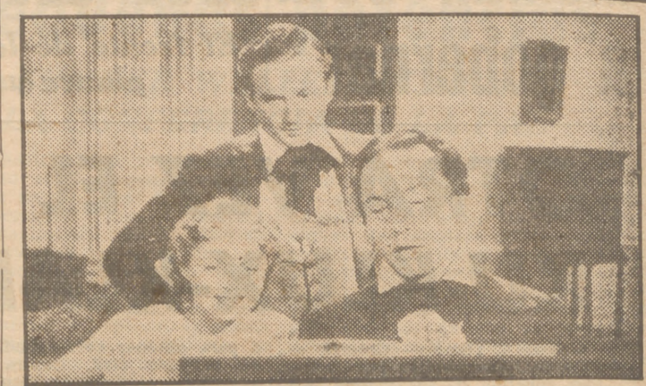
Reproducimos una escena de la extraordinaria película "El gran vendaval", film que será presentado por Astoria hoy, lunes, en el cine Avenida. El excelente actor James Mason, intérprete genial de "Perfidia", desempeña el principal personaje de "El gran vendaval".