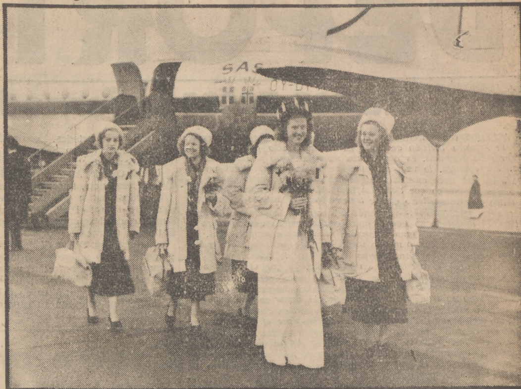
La reina Lucía, de Suecia, con sus damas de honor, cuatro de las cuales han perecido con ella, al ser arrollado el automóvil en que viajaban por un tren expreso

Un terrible epílogo ha puesto fin anticipado al programa de fiestas en el que debían participar la "Reina Lucía" de Suecia y las bellas muchachas que formaban su Corte de honor. La "Reina", elegida recientemente, y sus acompañantes, todas muchachas de diecisiete a veinte años, se dirigían en automóvil a un festival organizado por los obreros de la industria lechera. Entre las localidades de Norrköping y Linköping, al sur de Suecia, el vehículo fué arrollado y partido en dos por un tren—el expreso de Malmö—, y de resultados del tremendo choque