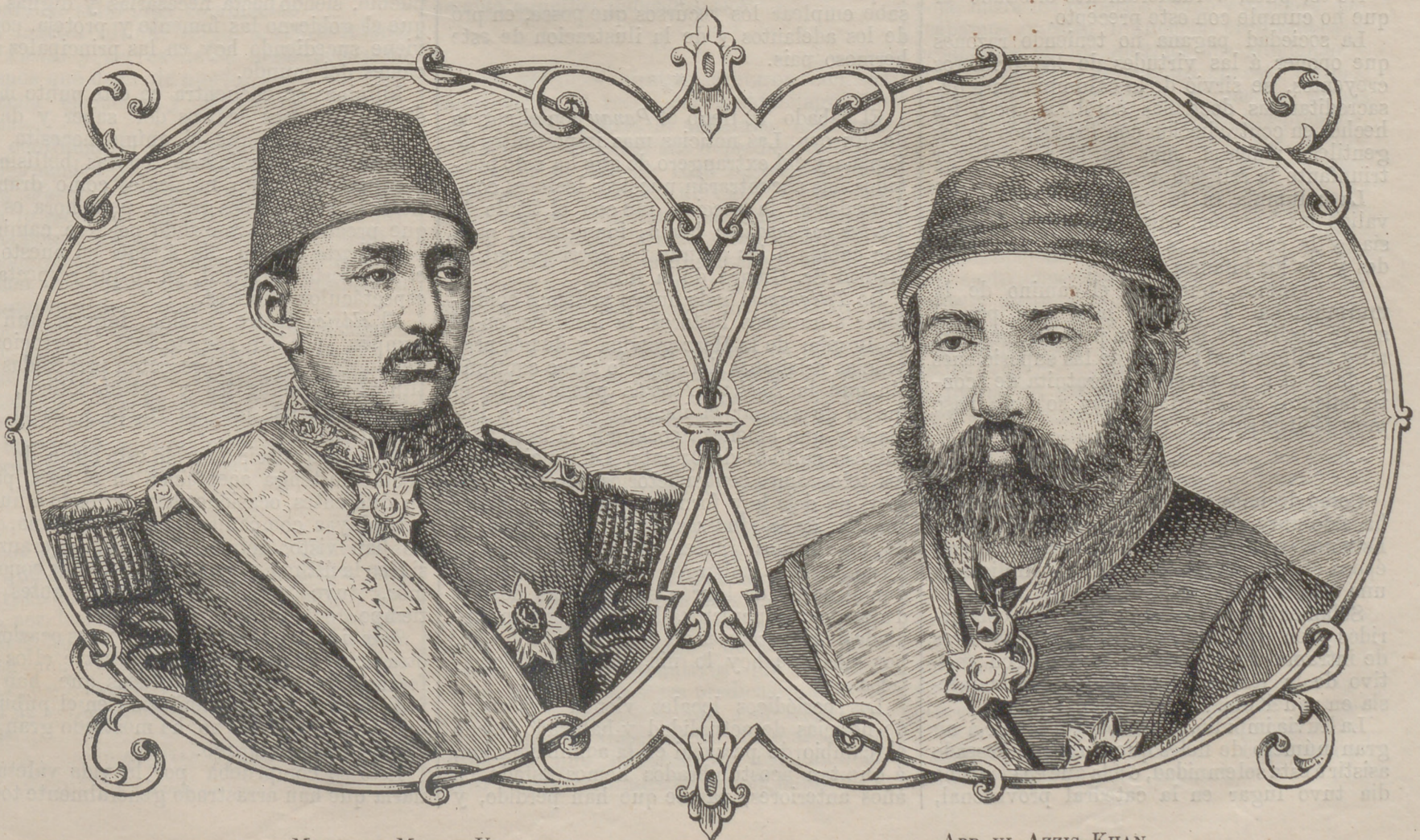
MEHEMET-MURAT V, ACTUAL SULTAN DE TURQUIA.

Susurro debe ser esta grato á los oidos de los habitantes ribereños del Pasig , cuando tan adelantada se la vé por cualquier parte que la miremos.