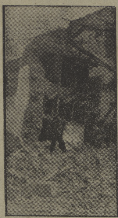
¡Casetas...! ¡Cumos ganadas con la bravura de nuestros milicianos

El día que hayáis pasado lo que en Casetas, ya podréis licenciáros de milicianos.