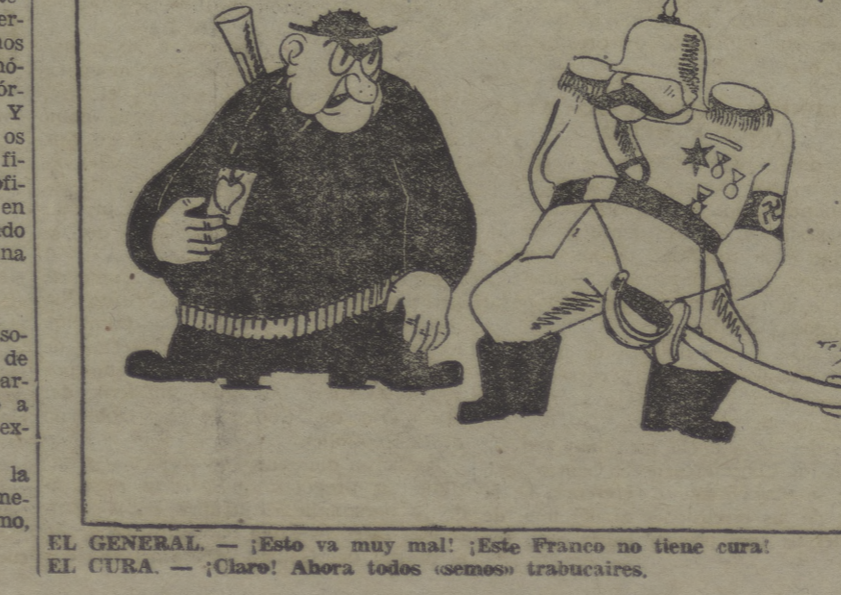
EL GENERAL. — ¡Esto va muy mal! ¡Este Franco no tiene cura! EL CURA. — ¡Claro! Ahora todos osamos trabucarse.

¿Cómo reaccionarán ante el resultado de estas elecciones? Sería haberse demudado la disolución de la antigua Cámara. Daban, los militares, un golpe de fuerza para eliminar la oposición del Parlamento y establecer su hegemonía absoluta sobre la vida económica y política del país. Todo es posible. Los obreros japoneses deben estar atentos, para evitar cualquier sorpresa de fatales consecuencias para ellos.