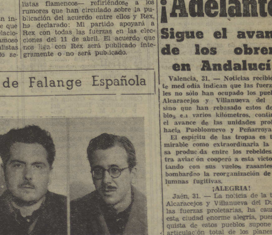
Los tres dirigentes de Falange Española, detenidos días atrás en una torre de la calle de Santaló, donde se halló un verdadero arsenal, preparados sin duda, para intentar un golpe de fuerza contra nuestra Revolución. De este hecho dimos cuenta oportunamente.