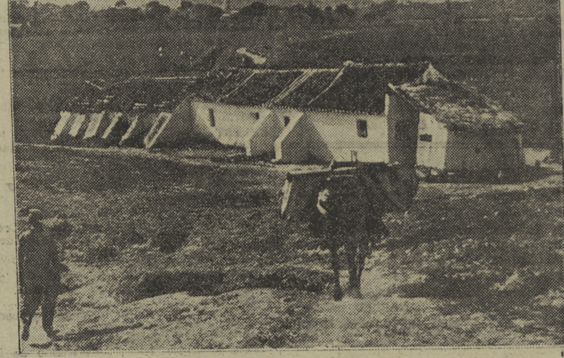
El cortijo queda atrás. Cargado en el burro todo el albar, escaso e impersonal, con la familia a cuestas, el campesino va corriendo los campos y las sierras para huir de los fascistas, llevando la alarma a los cortijos vecinos, que encienden en su camino. Que llegan los de Queipo... Los que se quedarán con las tierras para volverlas a entregar a sus antiguos señores, los que recogerán las cosechas, los que fusilarán al que se haya rezagado. La tierra, que desde hacia siete meses era de los campesinos. — ¡suya! — les parece más dura y senda que la cruz, más larga. ¿Cómo la encontrarán ligera, cuando la caminata sea para reconquistar lo que ganaron ellos y que ahora otros les han hecho perder!