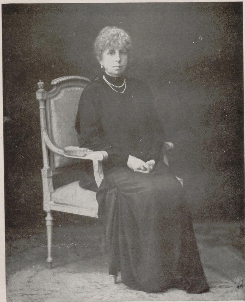
S. M. LA REINA DOÑA MARÍA CRISTINA