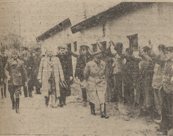
MADRID.—El Jefe del Estado, GENERALISIMO FRANCO, visita la barriada de casas para obreros que se construyen en el barrio de Usera, en sustitución de las que fueron destruidas por la revolución marxista.

ABUNDANTE INFORMACION DEL CONFLICTO RUSO-FINLANDES EN LA PAGINA OCTAVA