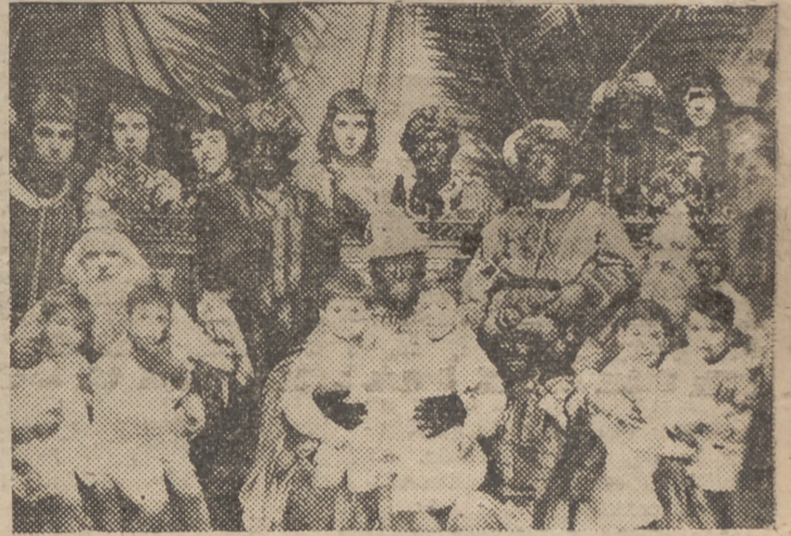
La llegada a nuestra capital de los Monarcas de Oriente ha sido para la grey infantil motivo de indescriptible alborozo. He aquí a Melchor, Gaspar y Baltasar, acompañados de su brillante séquito, en una de las muchas visitas que hicieron a los centros benéficos para repartir entre los pequeños -juguetes y golosinas.