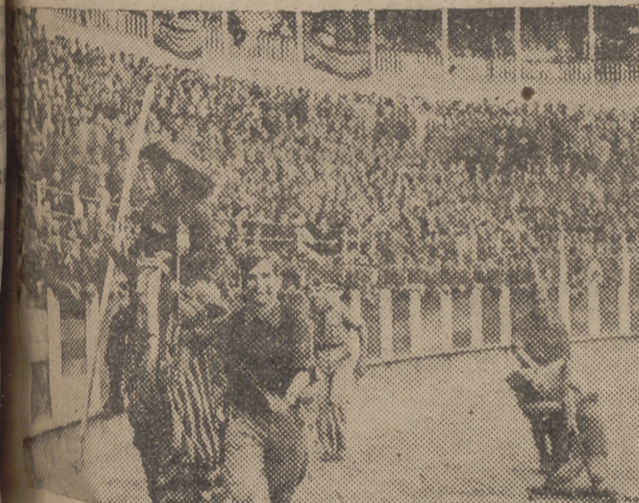
Un aspecto del desfile de la cuadrilla bufa en el festival celebrado en la Plaza de Toros.