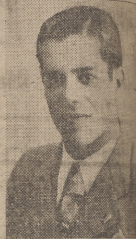
El mejor de los 22 jugadores

matrícula de honor si se matricularan como paracaidistas.