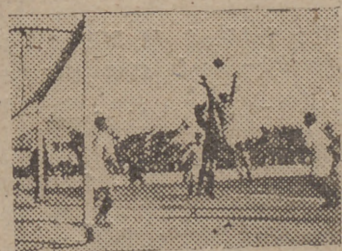
Un remate de Calderón y el meta sevillano al quite.