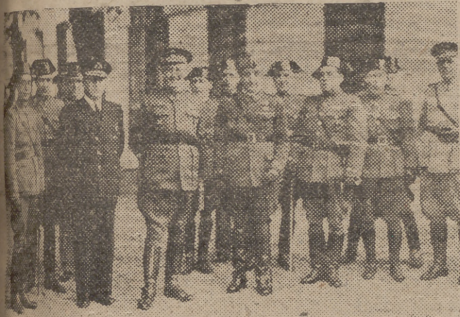
El inspector de la Guardia Civil, durante su estancia en el Cuartel de Natera, acompañado del Gobernador Militar, Comandante de Marina y jefes del benemérito Instituto.