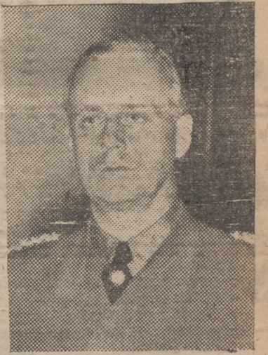
VON RIBBENTROP (Véase en páginas centrales)